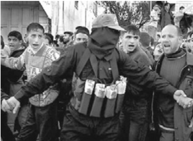
En maskerad Hamasanhängare iförd bombattrapper som försöker kontrollera en palestinsk demonstration

Det finns terrorgrupper som använder sig av ett religiöst språk. Religionshistorisk forskning kan hjälpa till att tolka detta språk genom att sätta in det i ett historiskt sammanhang. På så sätt kan vi förstå termerna och symbolerna och hur de används. Vi kommer grupperna nära och förstår inte bara hur de tänker men även hur de tagit till sig religiösa traditioner och tolkat dessa för att fylla vissa funktioner i anhängarnas liv. En förståelse av sådan utveckling måste dock kopplas till det vidare sammanhanget. En religionshistorisk analys av kopplingen mellan religion och terrorism kan därmed inte bortse från det sociala sammanhanget. En religion erbjuder ofta en uppsjö av traditioner som en individ eller en grupp individer väljer ur och tolkar på ett för dem funktionellt sätt. Hur detta sker beror på en mängd faktorer, från anhängarnas personlighet till omgivningen. Tar vi inte även hänsyn till andra faktorer än religion så kan vi inte förstå denna våldsamma utveckling.