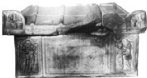
Bild 2. Framsidan av sarkofagen från Szekszárd. (Burger, Zs., Corpus signorum Imperii Roman. Corpus der Skulpturen der römischen Welt. Ungarn, band VII, Budapest 1991, Tafel 56:1. )

Bevarandetillståndet hos gravgåvor funna i sarkofager är generellt bättre då de legat skyddade. I de fall föremål gått sönder finns delarna samlade i sarkofagen, vilket innebär att det är lättare att rekonstruera dem.