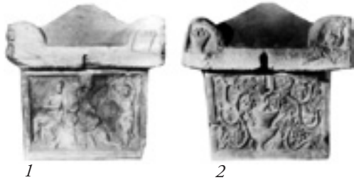
Bild 3. 1–2. Gavelfälten av sarkofagen från Szekszárd. (Burger, Zs., Corpus signorum Imperii Romanum. Corpus der Skulpturen der römischen Welt. Ungarn, band VII, Budapest 1991, Tafel 56:2-3. )

formen av ett åttondels klot som öppnas ut mot kistkanten. De på framsidan pryds av varsin mansbyst och en korg.