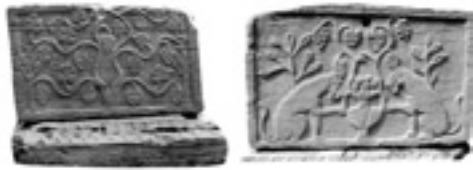
Bild 4:1-2. Gavelfält av sarkofagen från Veliki Bastaji. (Migotti, B., Evidence for Christianity in Roman Southern Pannonia (Northern Croatia). A catalogue of finds and sites, Oxford 1997, 43.)

har någon bevarad inskrift. På båda sidor om tabula ansata återfinns i nischer porträtt utförda i högrelief föreställande en kvinna i den vänstra och en man i den högra.