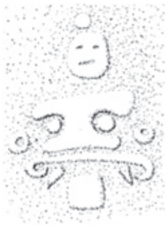
Regnguden Chaahk/Tlaloc i rejolladan Chakal Ja'as.

Hundra meter öster om pyramiden ligger en rejollada. Utmed den östra delen av rejolladan, 15 meter under markytan och under ett klippöverhäng, finns en enkel plattform flankerad av en mur. I en nyligen utgrävd kokgrop (en så kallad pib som används för att tillaga kött av byborna) i plattformen påträffades flera välbevarade äldre artefakter, bland annat en hel spjutspets. Platsens mest intressanta spår är dock de petroglyfer (ristningar i sten) som pryder rejolladans sydöstra botten. Där finns bland annat en förspansk ristning av regnguden Chaahk, sammanblandad med drag från den centralmexikanske regnguden Tlaloc (se bild). Den har två långa hörntänder, ”glasögonliknande” ögon, en möjlig mustasch eller en snirklig mun samt öronpluggar. Ovanför denna finns ett litet runt huvud. Dessa två avbildningar befinner sig strax norr om ingången till en djupare liggande grotta.