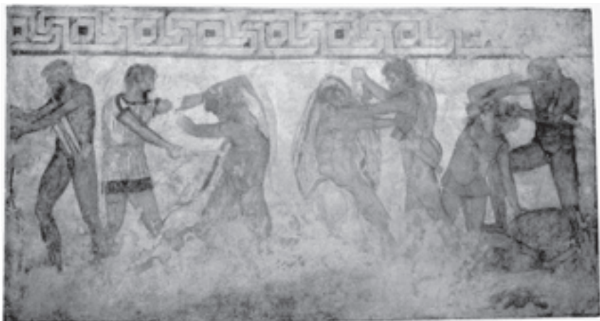
Bild 3. Den södra väggen i atriet till den innersta gravkammaren i Vel Saties grav i Vulci, nu kallad Françoisgraven. Det första paret på bildens vänstra sida visar Macstarna, romarnas kung Servius Tullius, som löser upp Caile Vipinas sammanbundna händer.

Låt oss återvända till den högra eller södra kammaren i Françoisgraven, bild 3.