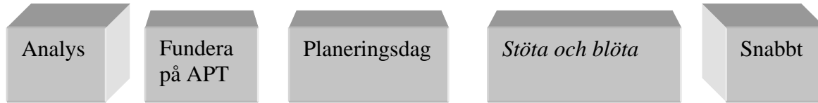
Figur 1 Implementering av förändringsprocess

Enligt Senge (2000) vidareutvecklas ständigt människors förmåga att förverkliga sina mål i en lärande organisation. Detta tankesätt fångar lite utav den anda som vissa respondenter önskat av sina chefer i deras ledarskap.