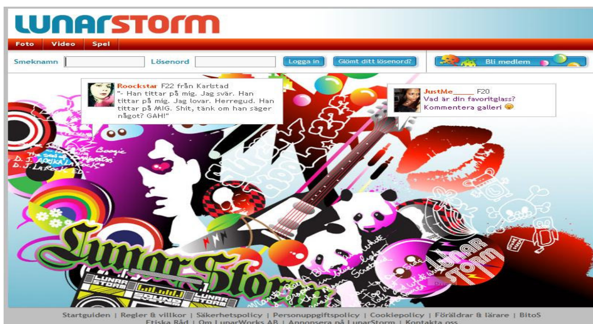
Bild 2. Från Lunarstorm, ett exempel på hur en webbcommunity kan se ut

användaren är en webbsida. Då behöver inte användaren installera särskilda program. Vilket vi berör i kapitel 4.