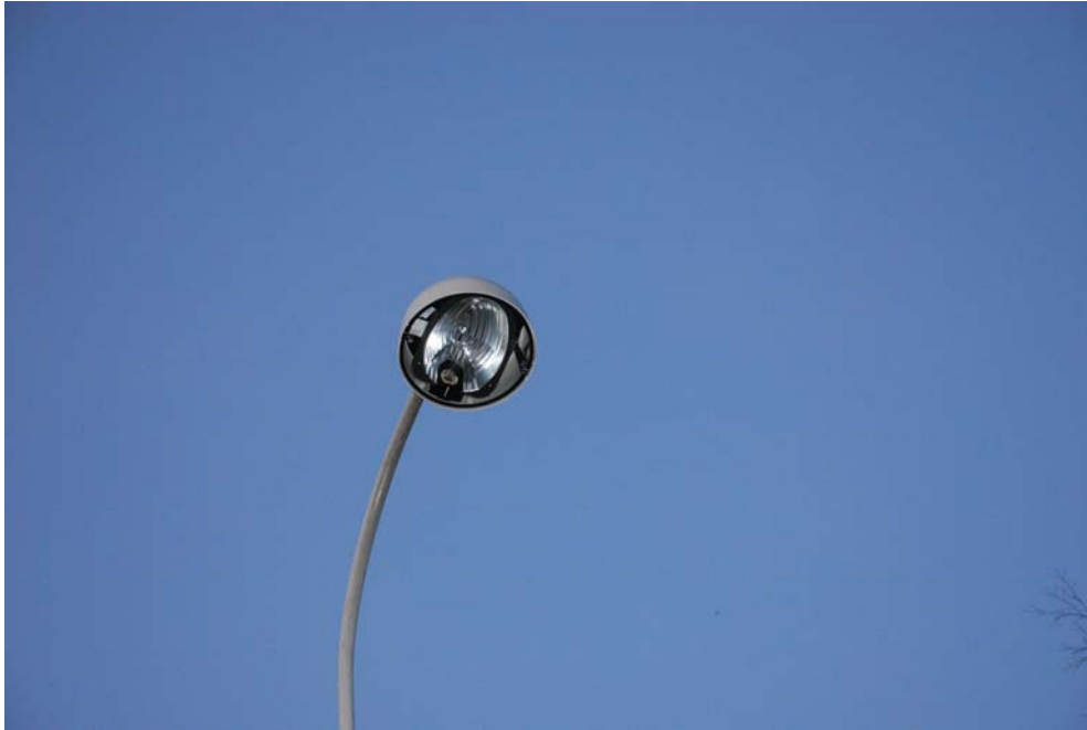
november 2008.