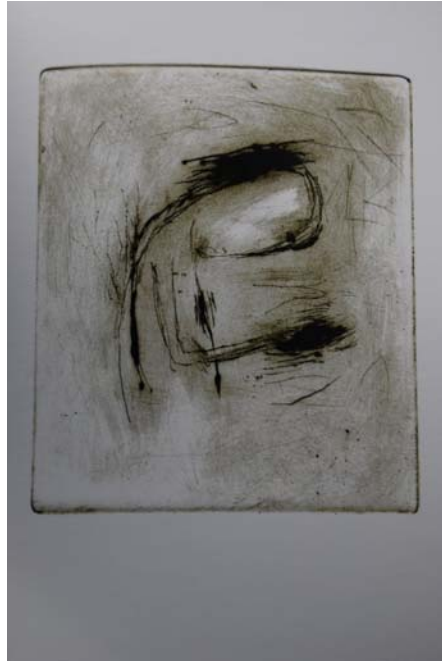
Foto: Johanna Ericsson, december 2008, av bild ur Nordström & Bergerud (2006).