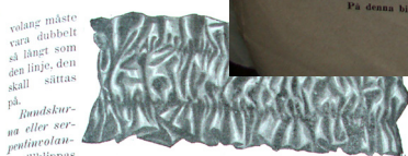
volang måste vara dubbelt så långt som den linje, den skall sättas på.

Rindskor-na eller ser-pentinvolan-ger tillklippas vanligtvis efter ett mönster. Smala serpentinvolanger kan man själv konstruera, i det man i en tygfyrkant, som ytterligare med hvarandra korsande linjer delas i fyra delar, inritar en från mitten utgående spiral med krita. De jämna afsändan måste göras så breda som man önskar att den smala serpentinvolangen skall bli. Detta framställningssätt ägnar sig emellertid, som sagt, endast för mycket smala garnityrer, enär dess vägighet blir något ojämn, hvilket icke skulle taga sig bra ut vid en något bredare garnityr. Vill man att ett vanligt serpentin-