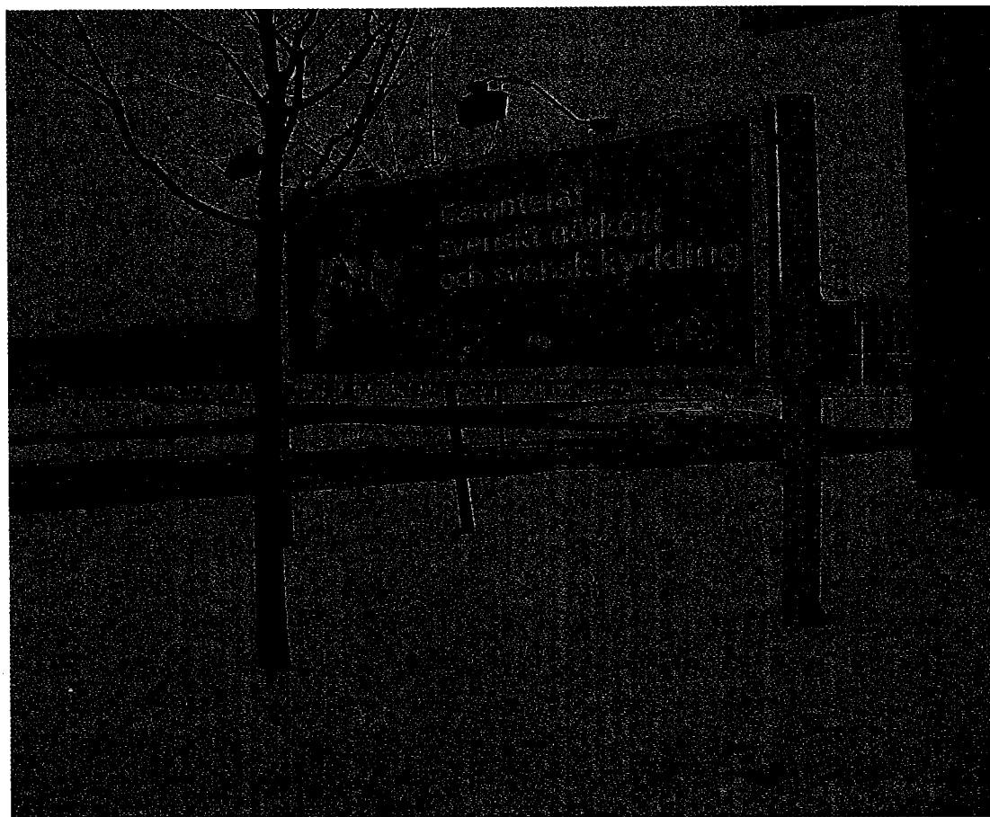
Bild 4: Hamburgerkedjan Max profilerar sig som "garanterat svensk".

Ett drygt år tidigare, våren 2003, uppmanade NSF på klistermärken och flygblad konsumenterna runtom i Norrköping att KÖPA SVENSKT AV SVENSKAR för att RÄDDA SVENSKT NÄRINGSLIV. När jag promenerar förbi