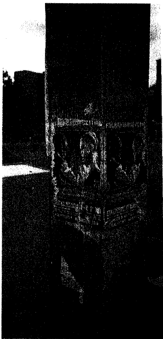
Bild 1: En av NSF:s propagandaaffischer kopplar "mångkulturalism" till "folk-mord".

ganisera den årligen återkommande demonstrationen i Salem, söder om Stockholm, manade under hösten 2004 till engagemang i samband med den stundande demonstrationen. PROTESTERA MOT DE SVENSKFIENTLIGA HATBROTTEN! utbrister ett av de många klistermärken som satts upp runtom i staden, såväl som i åtskilliga andra svenska städer, som PR för demonstrationen. Prefixen främlings- eller invandrar-, som vanligtvis åtföljer