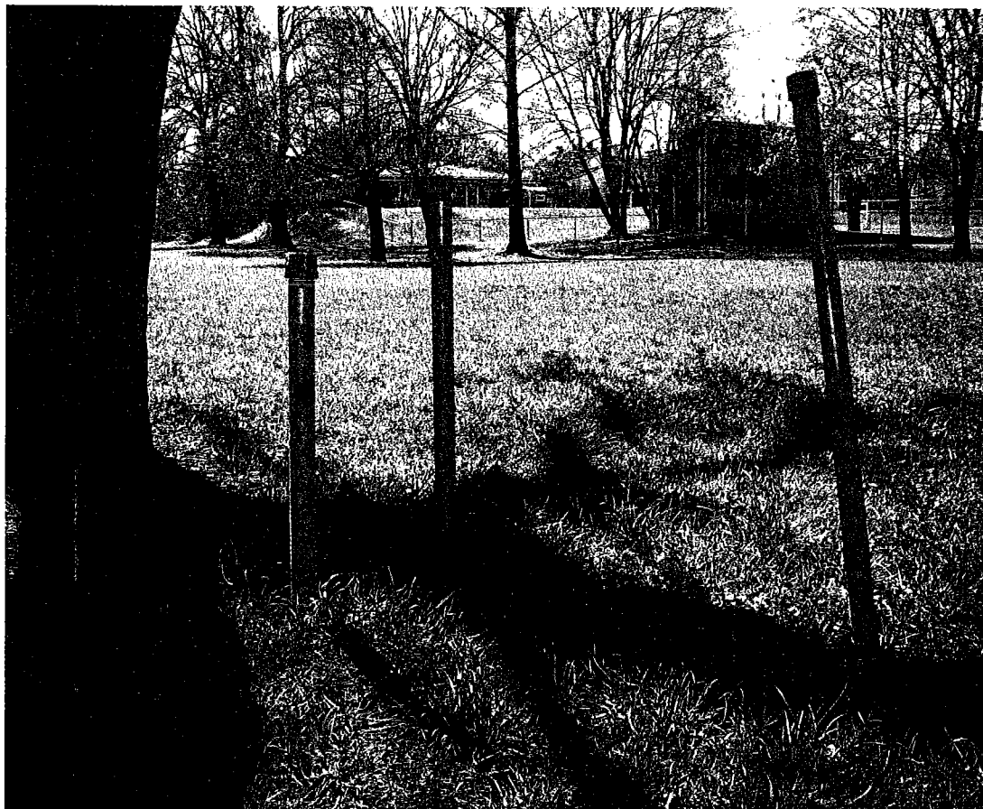
Bild 3: Röda prickar i Vasaparken, ett av flera exempel på "märkningen av rummet".

Området tycks symboliskt särskilt betydelsefullt att "märka". Parken var ett