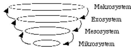
Figur 6. Bronfenbrenners modell av den ekologiska strukturen i miljön. (Min tolkning)