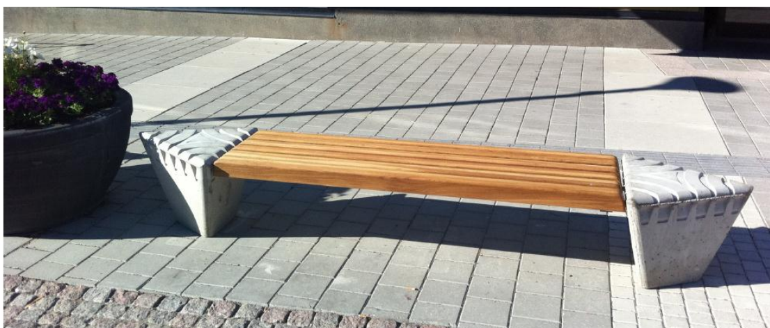
Bengtsforsbänken "Spår" av Oscar Honeyman-Novotny

Free Applied Art-projektet har blivit startskottet för ett djupare samarbete mellan kommunen och Steneby. Fram till idag har samarbetet utanför Free Applied Art-projektet omfattat två tävlingar (en skulptur till Utvecklingscentrum+ och ett räcke till den nya torgtrappan i Bengtsfors centrum) samt två kursprojekt som har resulterat i fyra prakturnor och ett förslag till bänk, båda designade direkt för Bengtsfors centrum. Bänkförslaget har därefter vidareutvecklats formgivaren (Stenebystudent) och Bengtsfors kommun till en slutlig bänk som nu produceras i 20 exemplar för Bengtsfors centrum och 4 exemplar för placering i Gröna tomten, Dals Långed.