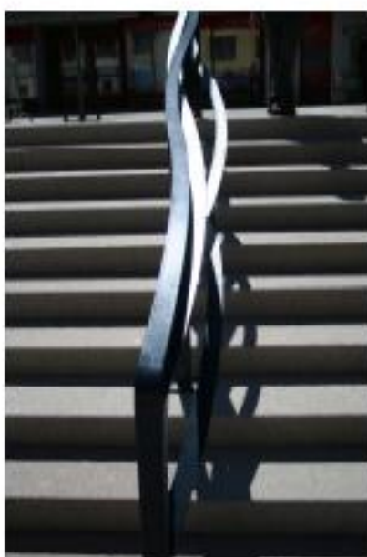
Räcke Åder av Anton Johed