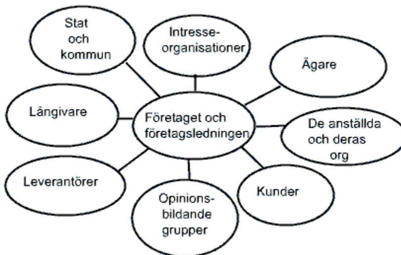
Figur 1: Intressentmodellen sid 74 (Bruzelius & Skärvad, 2004)

Att miljödiplomera sig kan ses som ett sätt att kommunicera miljömedvetenhet till sina intressenter fortsätter Ljungdahl. Detta kan jämföras med miljöredovisning då detta är till för att nå samma mål. Redovisning av miljöinformation kan ses som en övergripande strategi för att hantera relationen med intressenter som är av betydelse för verksamheten. Att ha en utbredd miljöredovisning eller miljödiplom gynnar företaget ekonomiskt, men även företagsledningens inställning till hela processen har också inverkan på resultatet av de ekonomiska effekterna 37 .