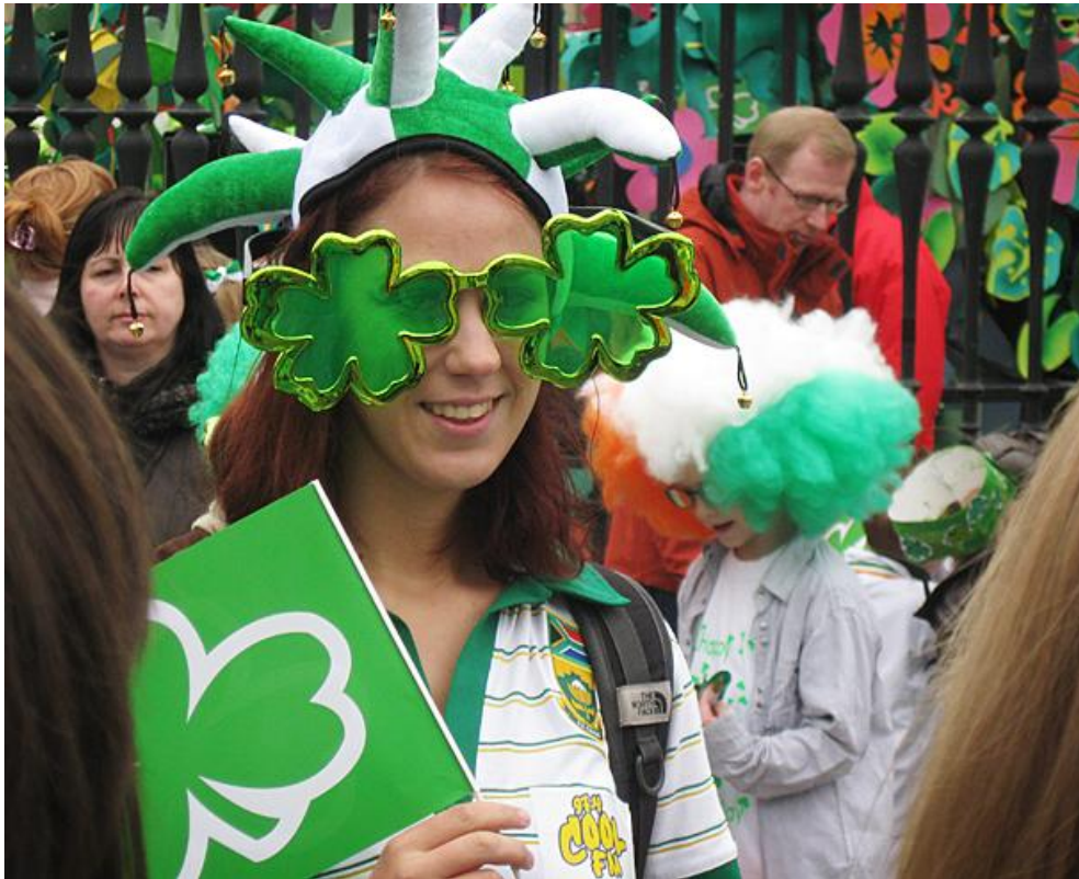
Ovan: St. Patrick's Day. Nedan: Cross-community pusselkonstverk vid Short Strand.