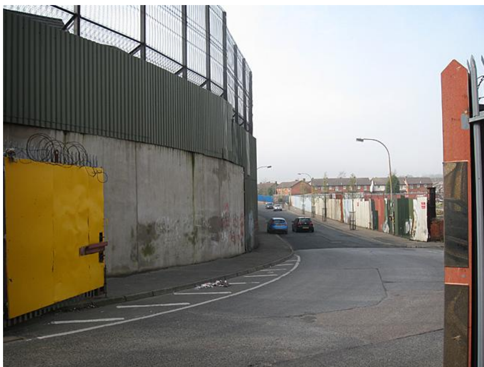
Ovan och nedan: Fredsmuren.