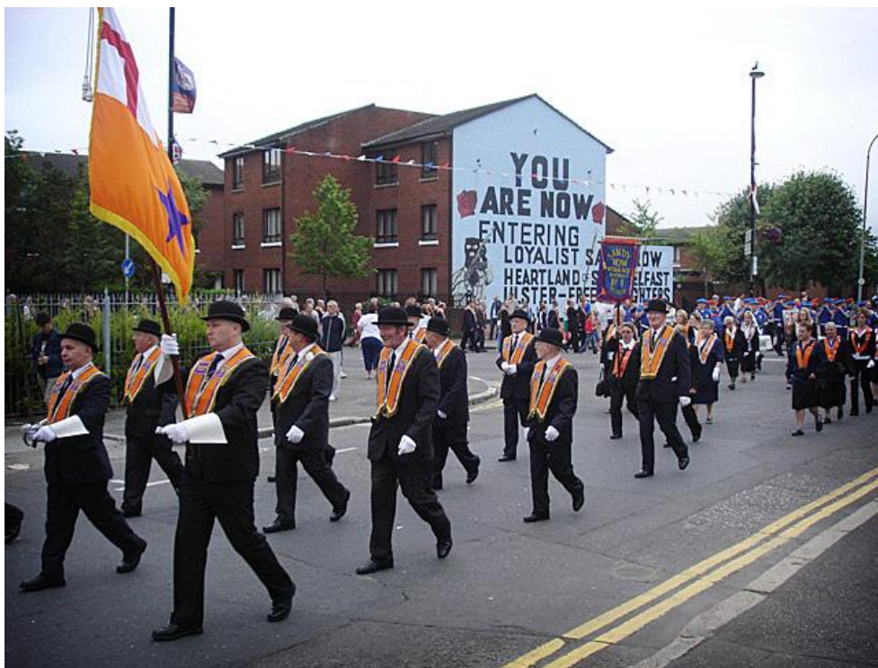
Ovan: Oranienparaden. Nedan: Brasor som startats av barn som del i Oranienfirandet.