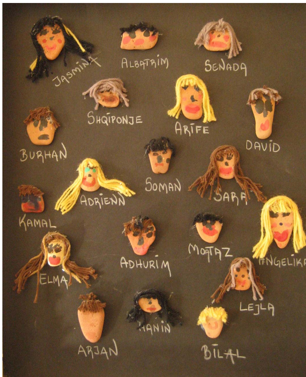
Vår klass, självporträtt.

Kompetensutveckling för pedagoger i grund- och gymnasieskolan, samt pedagoger i förskoleklassen och fritidshemmet