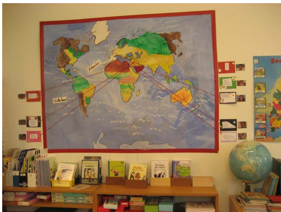
Elever från olika håll i världen i samma klassrum.