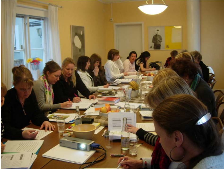
Koncentrerade lärare under en kursdag i FLiS 2.