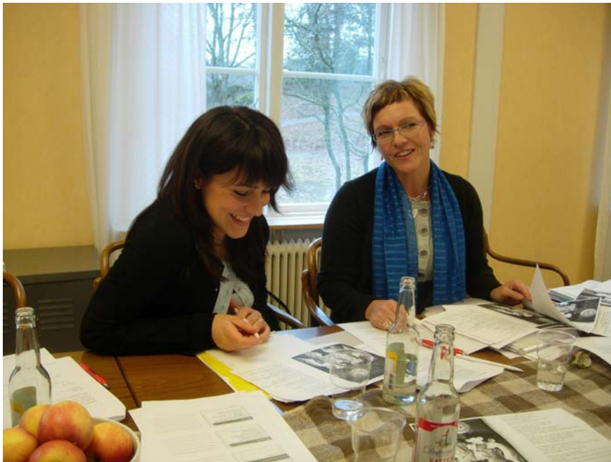
Två av FLiS2 kursdeltagare