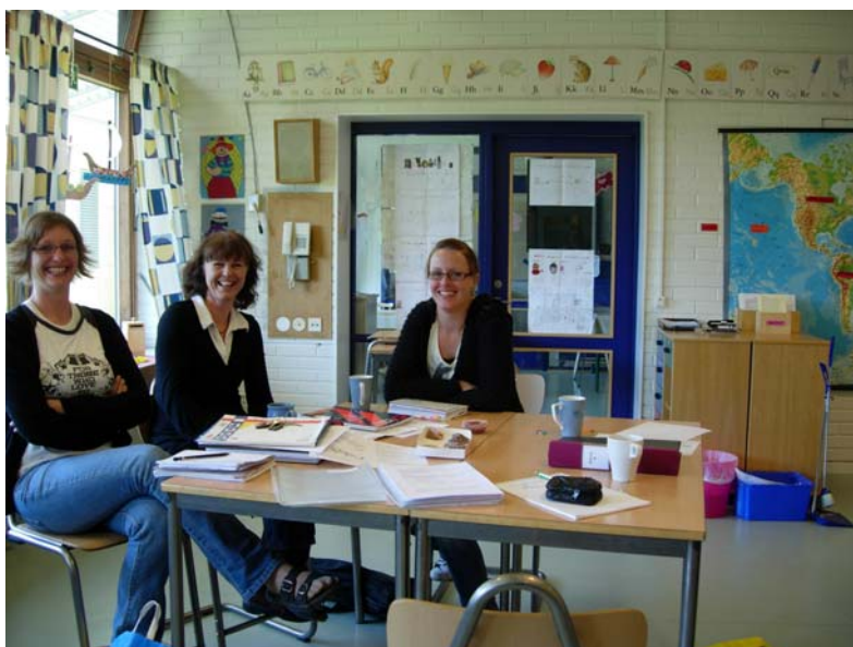
Handledning av språkutvecklingsprojekt på skola i FLiS2-kursen.