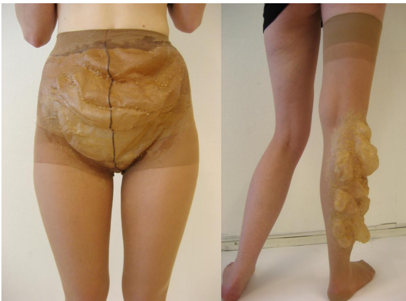
Mage & Ben. Strumpbyxor stärkta med latex.

Jag behövde någon mer metod som gjorde mig fri att skulptera fram den form jag önskade, direkt på dockan. Med ullen var jag bunden vid att utgå från formen som uppstod när jag tovade. Jag införskaffade ett vax som gick lätt att modellera med, samt var möjligt att fästa på dockan. Med hjälp av vaxet byggde jag upp olika strukturer och former. Jag trädde strumpbyxor utanpå och stärkte med latex och sedan avlägsnade jag vaxet. Det blev en mage och ett ben. Tanken om att använda strumpbyxor som material fanns med en tid i början av arbetet och jag provade olika sätt att skapa former utav dem. Till slut valde jag dock bort strumpbyxorna helt (även strumpan med bölder, som jag ändå var väldigt förtjust i) då jag kände att det inte var rätt känsla i materialet.