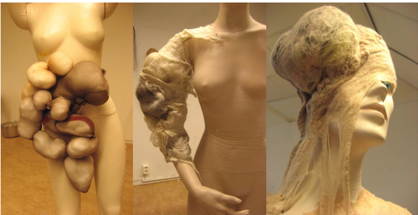
Skisser på dockan