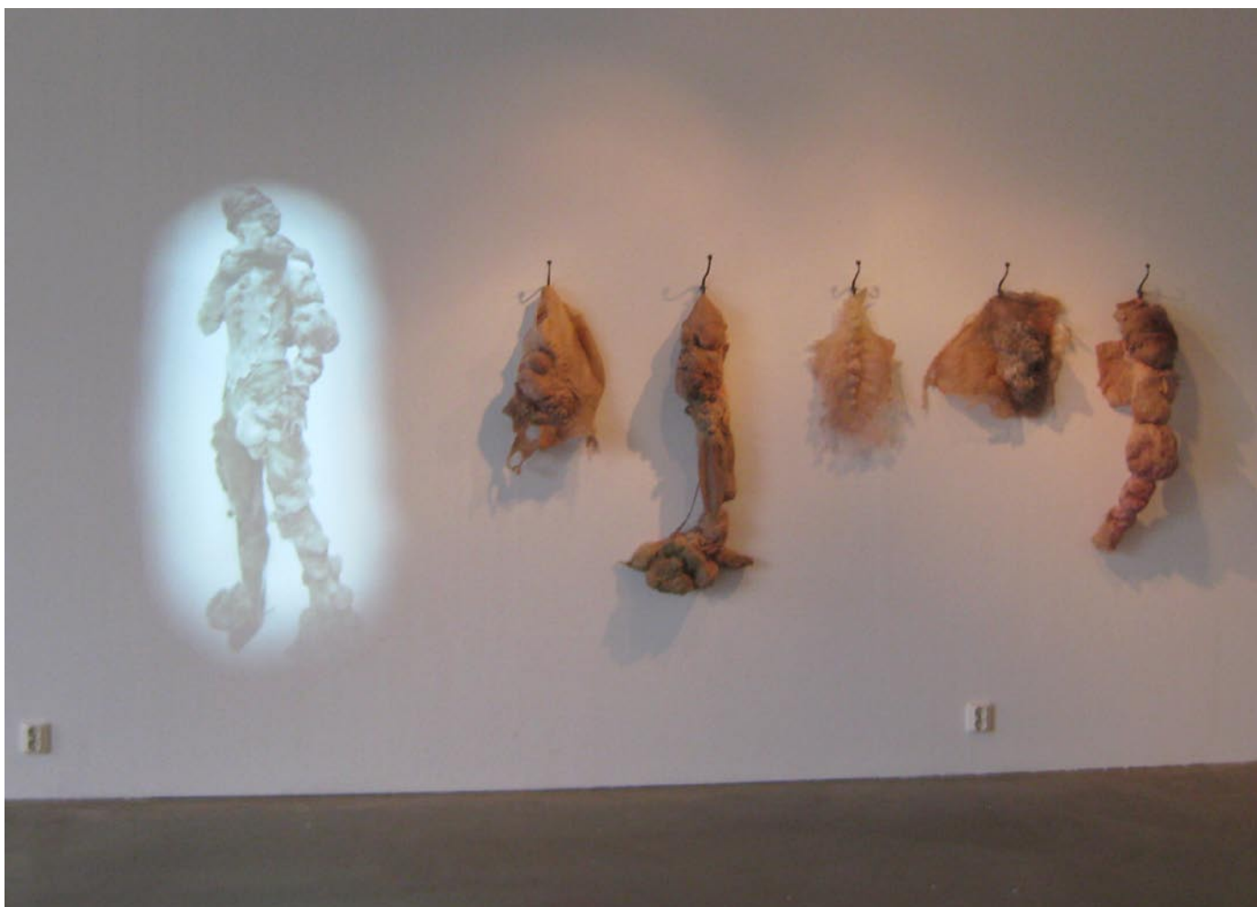
Foto av den slutliga upphängningen

Slutligen valde jag att presentera några av delarna upphängda på krokar direkt på väggen och projicera filmen vid sidan av. Jag insåg att det blev överflödigt att visa alla delarna eftersom jag hade filmen där man kan se hela förvandlingen.