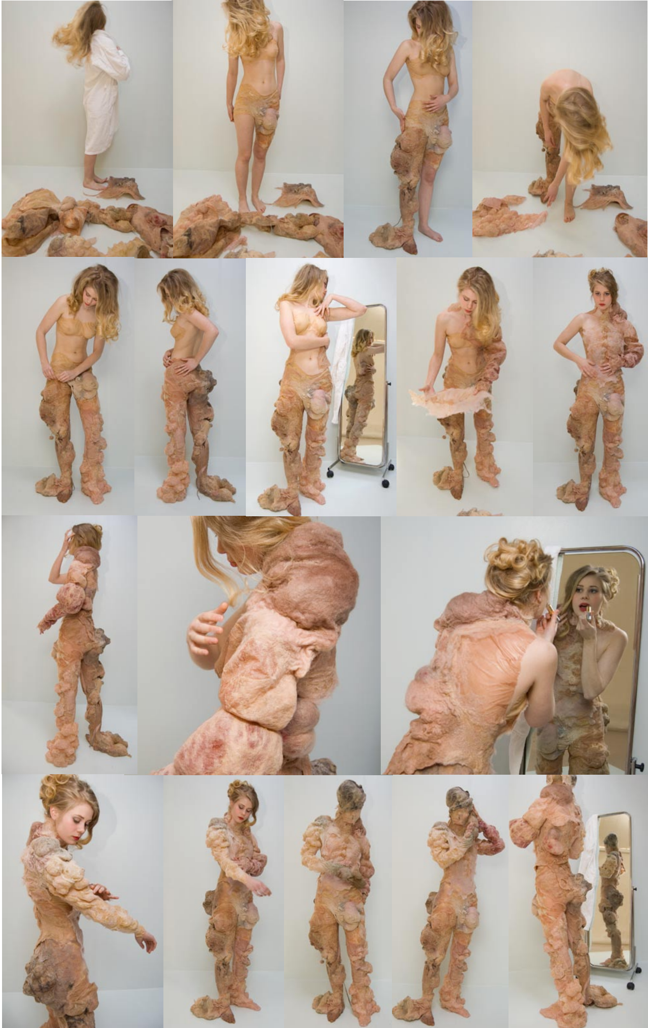
Modell: Sofia Olander