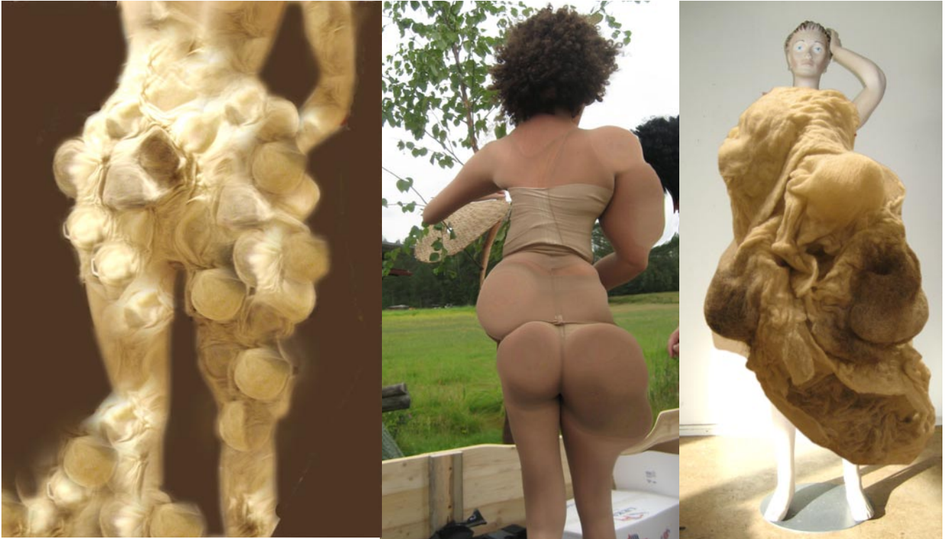
Skisser i datorn

I datorn skissade jag på olika former genom att manipulera om foton. Jag förstörde och förminskade olika delar av kroppen. Jag undersökte även hur stora förändringar jag ville göra. Då kom jag fram till att jag inte ville ändra kroppen helt. Jag ville att det fortfarande skulle framgå att det var en mänsklig kropp jag utgått ifrån. Vanligtvis skissar jag direkt mot kroppen så jag övergick till att bygga direkt på en docka. Jag försökte att inte tänka så mycket på hur resultat skulle bli utan experimenterade fritt på dockan. Till experimenten använde jag de tovade ullbölderna och andra material jag hade till hands. Jag letade efter former som kändes intressanta samt undersökte var kroppen skulle förändras.