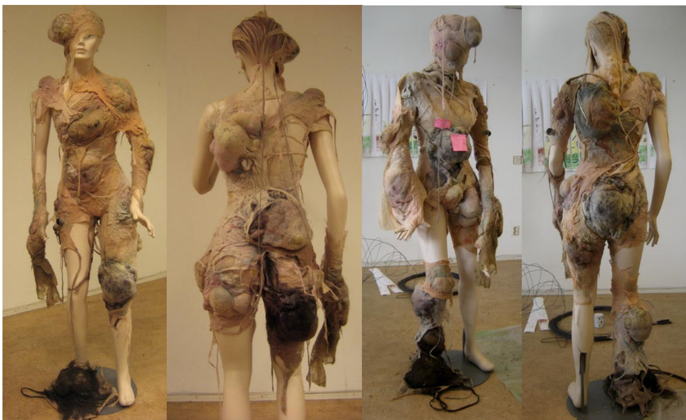
Undersökande av helheten

Först tänkte jag att alla de kommande skapta delarna skulle passa ihop men inte nödvändigtvis visas tillsammans på en kropp. Tanken var att vid fotograferingen använda flera modeller och därmed kunna visa alla delar samtidigt. Efter ett tag insåg jag att jag ville kunna sammanföra alla delar på en kropp, för att vid fotograferingen kunna klä på modellen del för del och därigenom visa en förvandling. Jag ville att personen skulle transformeras totalt. Hennes ursprungliga identitet skulle försvinna helt eller gömmas undan. Jag experimenterade på dockan genom att placera ut ofärdiga delar och flytta runt dem för att få en ungefärlig bild av helheten.