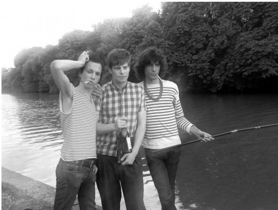
1, 2, 3. Bilder på min pappa och hans bror runt 1970 4. Bilder på vänner i Paris, sommaren 2009.