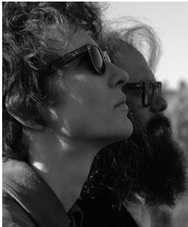
Cate Blanchett som Bob Dylan i filmen I'm Not There