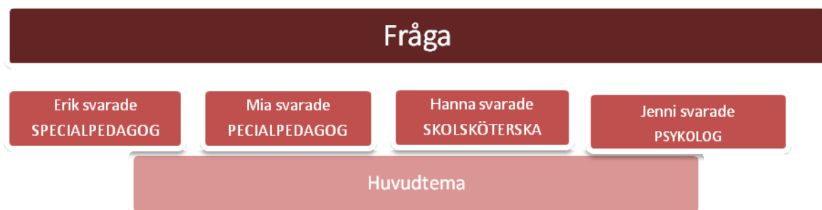
Figur 2 En illustration av hur arbetet fortskred med att anlaysera intervjutexten

Figuren nedan illustrerar mitt sätt att analysera texten.