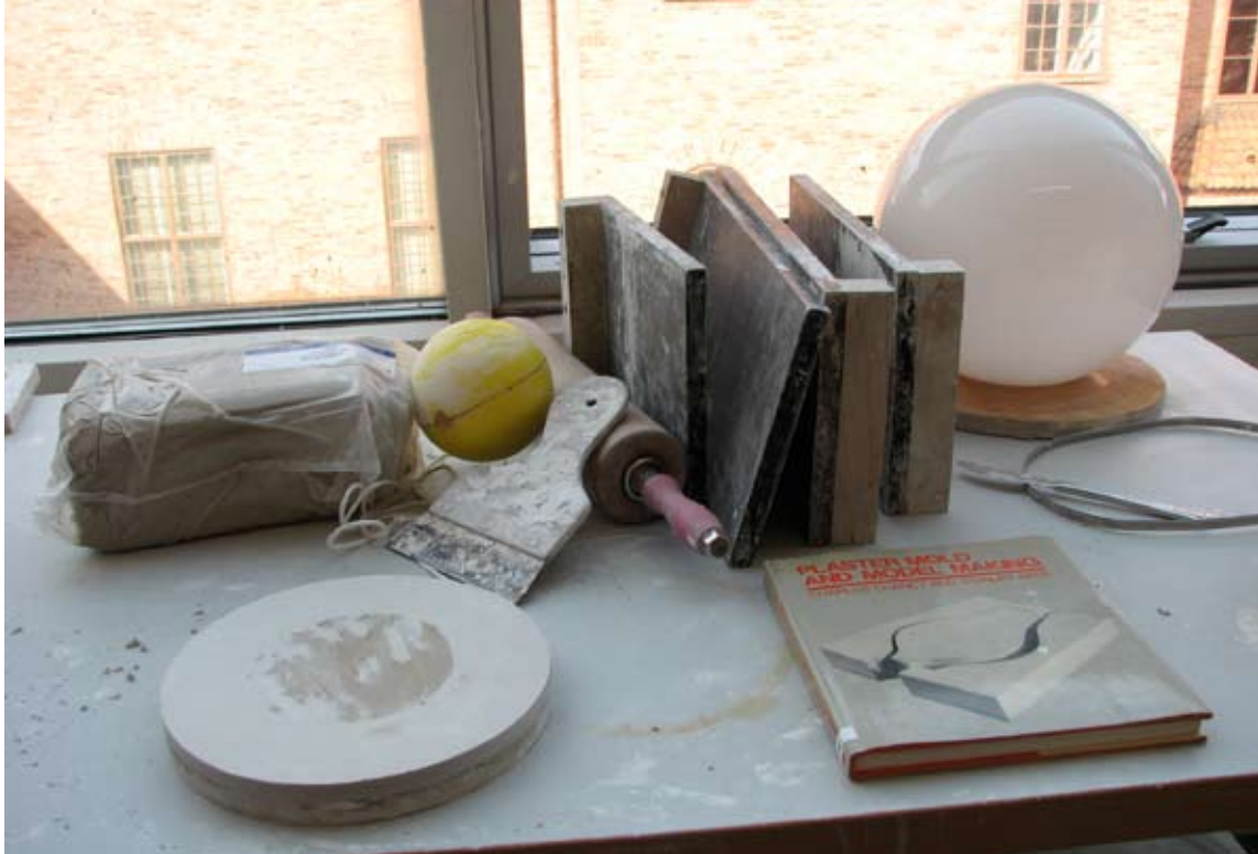
Ovan: Arbete i gipsverkstan.