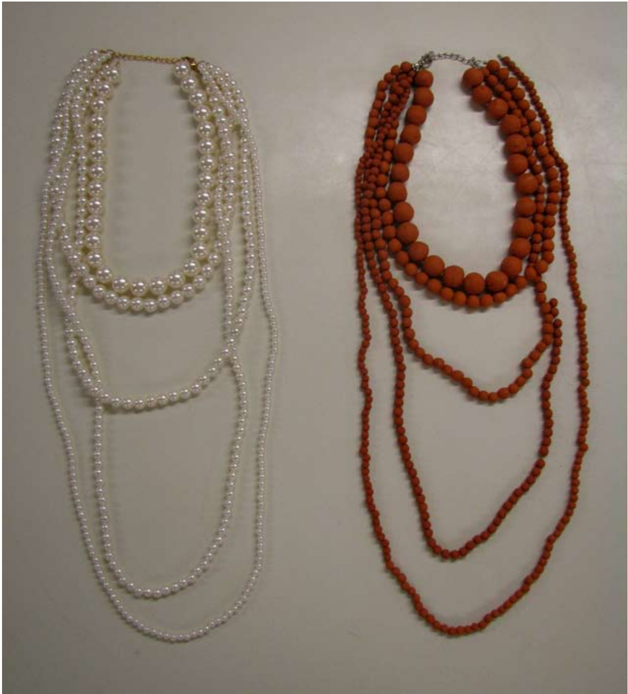
Pärnhalsband i plast från H&M till vänster. Färdiga pärlhalsbandet i lergods till höger. Längsta länken är ca 110 cm lång.