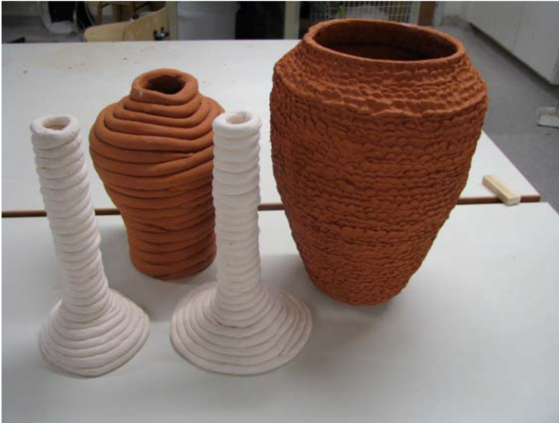
Urna till vänster ringlad i lergods ca 23 cm hög Urna till höger, ringlad, sedan tummad i lergods, 30 cm hög. Ljusstakar, ringlade i porslin, ca 25,5 cm höga