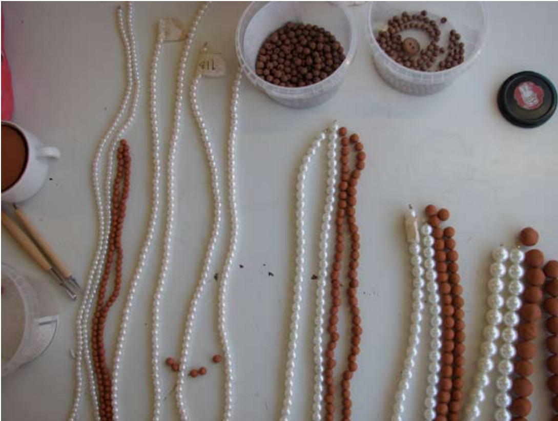
Under arbetet med att tillverka pärlhalsbandet i lergods

Halsbandet blev otroligt vackert och tilldragande när jag satt ihop det. Vilket kanske inte var min mening. Jag ville undersöka vilken effekt det kunde ha att pärlhalsbandet var gjort i ett annat material och jag förväntade mig ett annat resultat, inte ett vackert halsband, som dessutom blev så mycket mer värdefullt än förlagan. Jag funderade mycket kring detta halsband, inget med det uttryckte något annat än ett vackert smycke. Efter en handledning av en vän och konstnär förstod jag att det handlade om bruksfunktionen. Halsbandets enda synliga funktion var att vara ett smycke, att bäras och eftersom den funktionen var den som till synes var primär försvann den möjliga funktionen av halsbandet att vara bärare av en kommentar till materialets