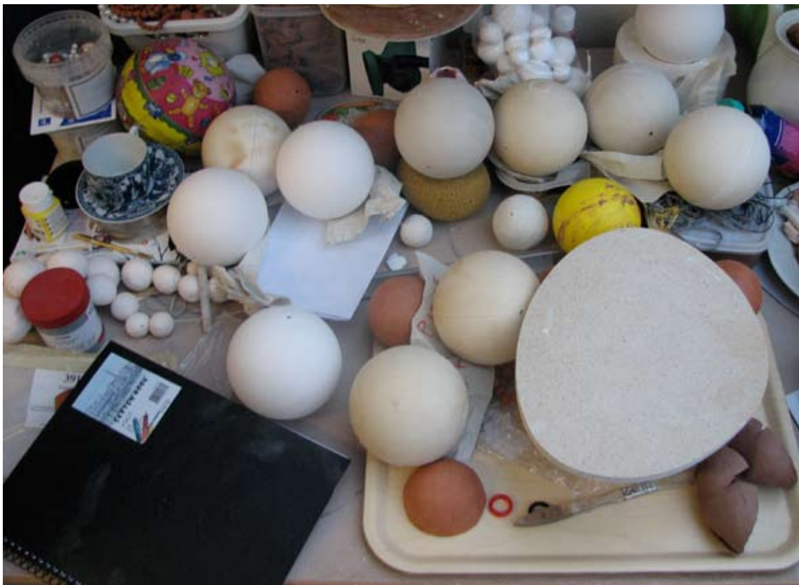
Nedan: Min bänk.