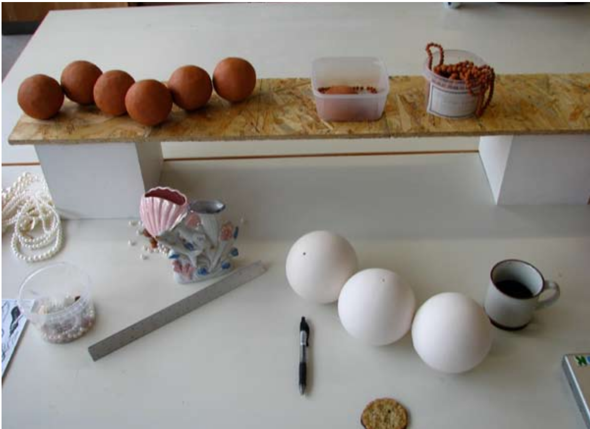
Nedan: Skissarbete med olika objekt, material och podier.