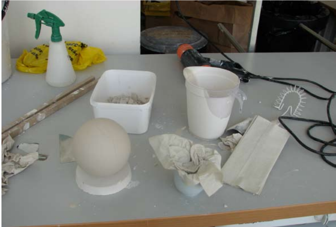
Ovan: Arbete med att gjuta.