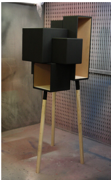
Mock-up & prototyp