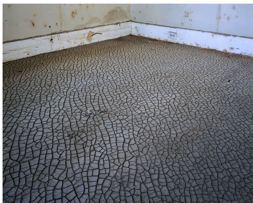
Lertäckt golv efter Katrina katastrofen

Detta koncept knyter an till mina tankar om barriärerna vi skapar mellan oss och naturen. För att vårt samhälle ska fungera så behöver vi begränsa och skjuta undan naturen. Chris Jordan är en fotograf som har dokumenterat vad som blev kvar efter orkanen Katrina i New Orleans. Med sina bilder visar han vad som händer när våra gränser mot naturen bryts och naturen tvingar sig in i vår miljö.