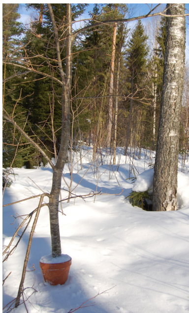
Inomhuskruka på uteträd

Om vi använde dessa begränsningsverktyg ute i den något "vildare" naturen, hur skulle dessa uppfattas. Skulle de skänka en känsla av trygghet då miljön kanske blir mer familjär för oss.