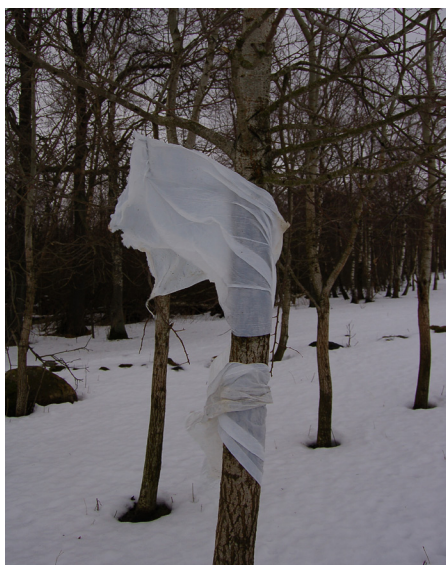
Plast / Träd

Jag gjorde experiment med plast som fastnat i träd. Mötet mellan de två materialen och hur plasten anpassade sig till trädet fascinerade mig. Jag såg detta som en möjlighet att skapa något vackert och intressant inspirerat av något värdelöst och önskat, sådant som vi lämnar efter oss och som har förlorat sin ursprungliga funktion.