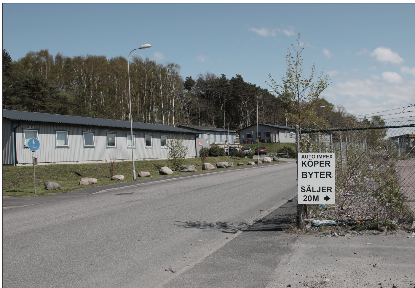
I Högsbo industriområde ligger ett långtidsboende för personer med missbruksproblem kombinerat med psykosproblematik.

”Det är klart att boendetrappan fortfarande finns fastän de säger att den inte gör det. Jag går ju i den.”