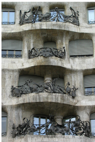
(Detalj ,Casa Milà ,samarbete mellan Gaudí och Jujol, Barcelona, 1908.)

Jag anser att Gaudi och Jujol delade en revolutionerande syn på framtiden genom det förgångna.