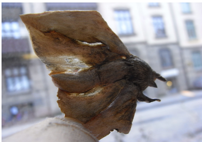
(Detalj skuren i lönn, yta; grafit, schellak, 40x35mm)