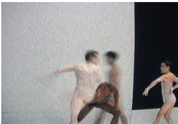
Ex. foton från processen