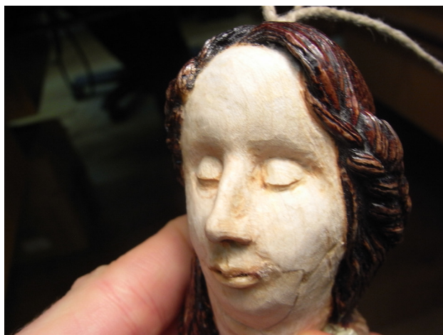
(Bilder från arbetsprocessen)