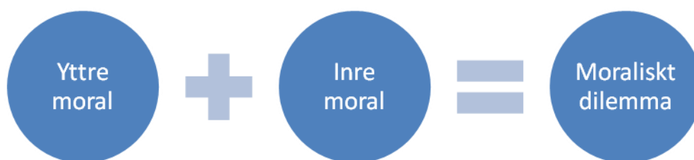
Figur 3 Moraliskt dilemma

I figuren nedan vill vi sammanfatta respondenternas definition av vad ett moraliskt dilemma är. Vi använder oss av begreppen, utifrån vår definition, inre och yttre moral och skriver i dessa kategorier in de faktorer som respondenterna har beskrivit är bidragande till moraliska dilemman.