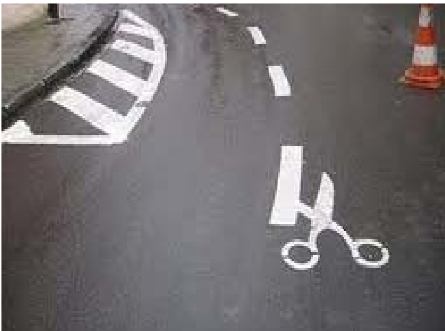
Det kan anses vara fascinerande att några streck på gatan kan hålla bilister i schack och på rätt sida av vägen – och förhindra folk från att köra precis som de vill över den yta som kallas väg. Av 'Roadsworth'.