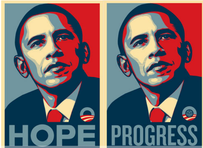
Bild gjord av Shepard Fairey, politiskt orienterad Street Art-konstnär. Köptes till presidentvals-kampanjen -08 in av demokratiska partiet (USA).