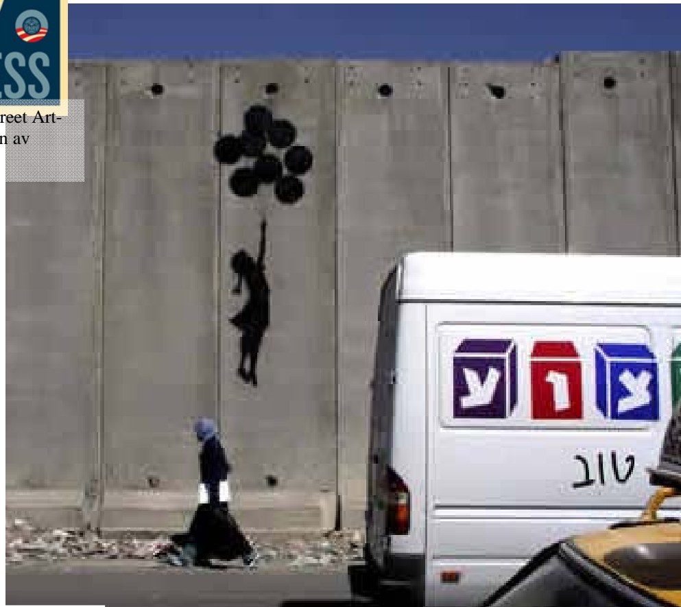
Bild på muren Palestina/Israel, av Banksy