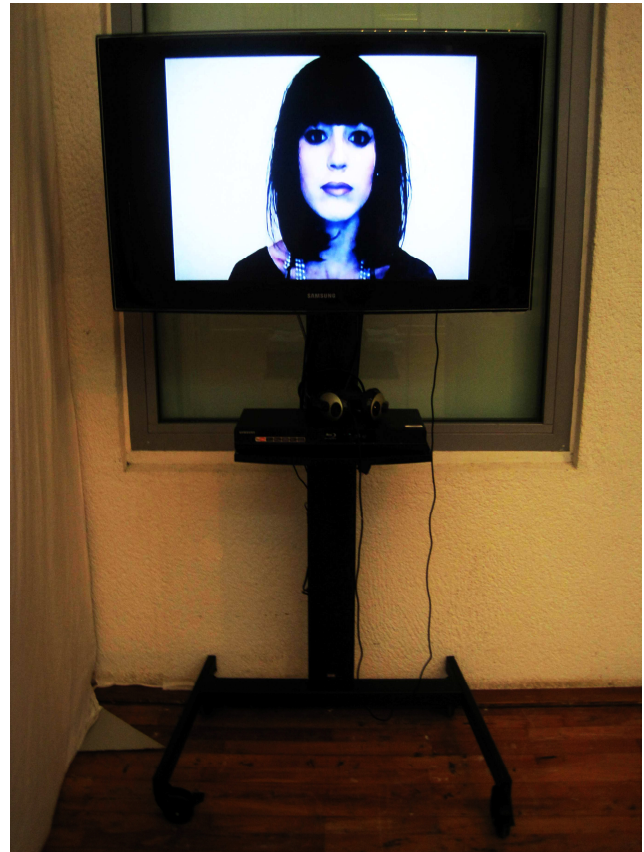
Satisfaction – Film