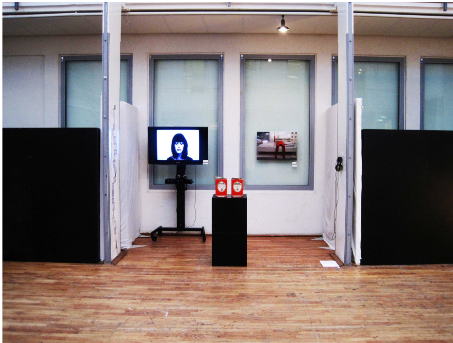
Hela verket framifrån

Följande fotografier är tagna av mig. Fotografierna är från examensutställningen i aulan på HDK 2011-01-11. De visar min utställning av det pedagogiska verktyget, samt spår av det som skapades under processen. Två burkar med tema- och teknikklappar och fyra assignments med kombinationerna Satisfaction - Film, Kontrast – Fotografi, Vakuuum - Tusch och Utopi - Ljud.