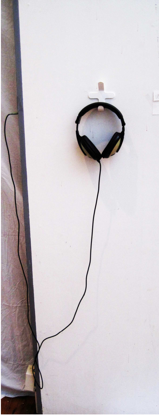
Utopi - Ljud