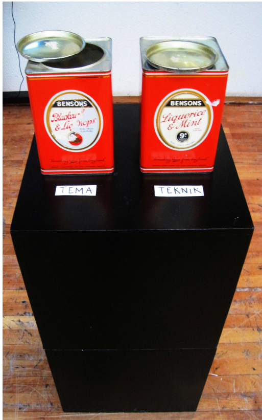
Tema- och teknikburkarna