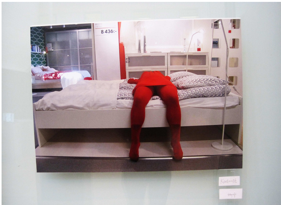
Kontrast – Fotografi