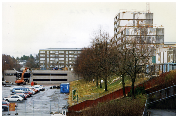
Hammarkulletorget 1-12 från ungefär samma vinkel 1977 respektive 1996.