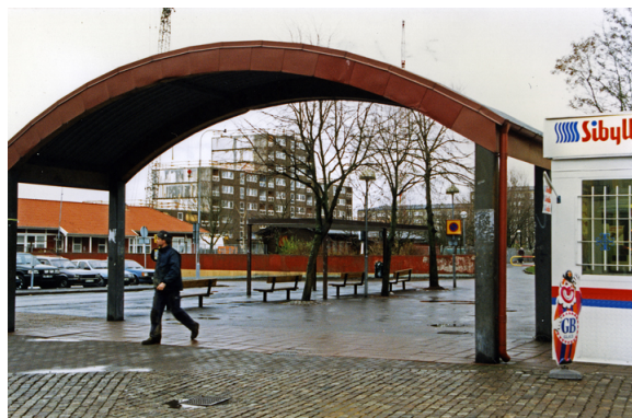
Hammarkulletorget 1996.

Den 5 mars 1994 skriver Björn Gunnarsson på Göteborgs-Postens kultursida under rubriken ”I utkanten av en utkant” om Hammarkullen. Gunnarsson inleder: