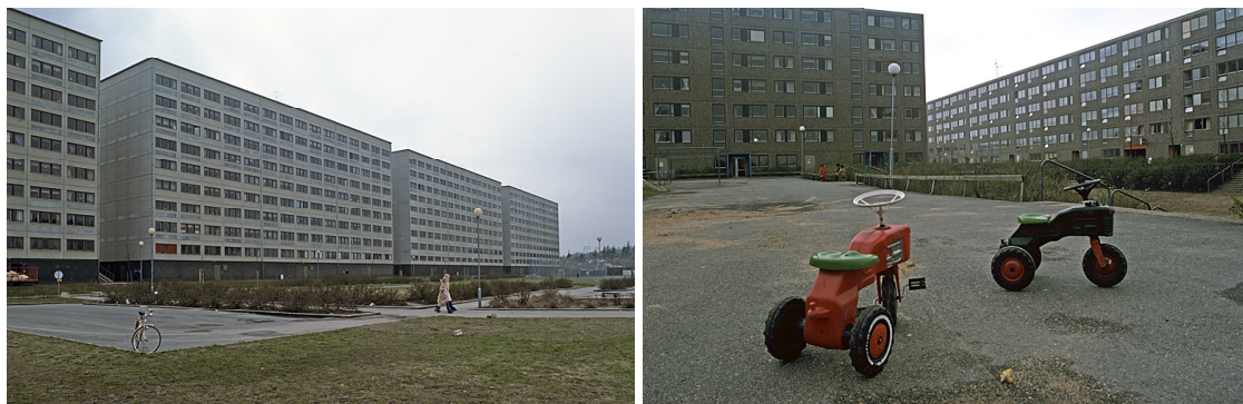
Hammarkullen 1977.

tänkt samt att arkitekterna menar att det var byggbolagen och ekonomin som gjorde miljöerna torftigare än vad de hade velat. 60