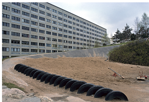
Hammarkullen 1977.