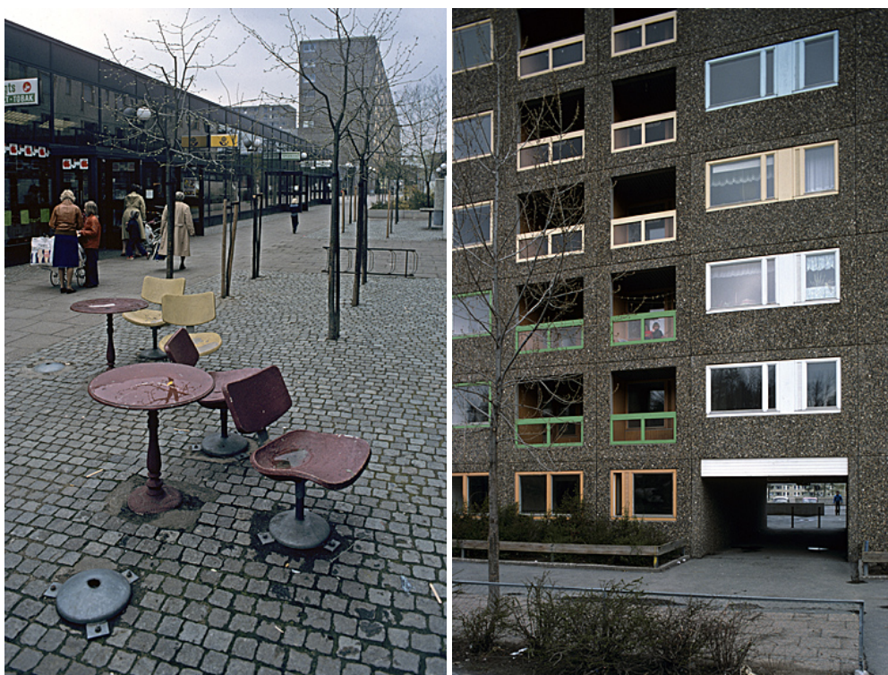
Hammarkullen 1977.