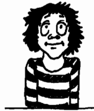
varken lätt eller svårt