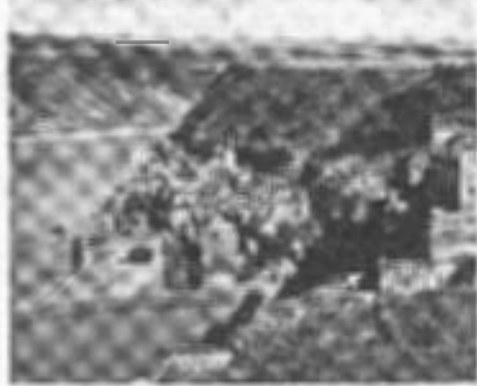
En stor och imponerande byggnad i Hermoda

Mediet ett betydligt antal deltagare kan medtagas. Förskola för ditt barn med om plats. Högt utbildigt program. Upplysningar om kurserna, Hermoda, m. m. ang. Neil Johnson, Hermoda, Malmö. Tel. nummer 17 "Hermoda".