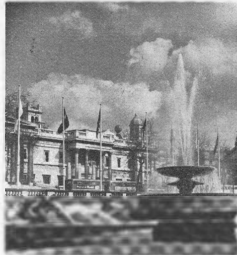
Trafalgar Square, London, och National Gallery i bakgrunden