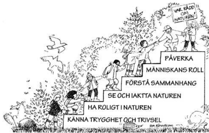
Figur 1. Ericssons utvecklingstrappa. (Ericsson 2002 s.6)

Ericsson (2002) betonar vikten av att alla elever behöver röra på sig och framförallt på olika naturliga sätt. Hon tar även upp att många elever tillbringar för mycket tid framför datorn och teven, vilket i slutändan blir ohälsosamt. Fysisk aktivitet har försvunnit på grund av alla tekniska intressen som våra barn har idag. Enligt Ericsson är det viktigt att eleverna ser rörelse som någonting positivt och ser på undervisning i naturen som en positiv upplevelse. Det är även viktigt att eleverna genom rörelse och undervisning i naturen tränar upp sin koordination, rörelse och kroppsuppfattning. Hon nämner att motoriken är en viktig del i elevernas lärande (s. 7). Nedan är en utvecklingstrappa som Ericsson har utvecklat och de olika trappstegen visar olika steg som eleverna behöver ta sig upp för, för att nå upp till toppen. Vidare menar Ericsson att elevernas utveckling handlar om att eleverna måste uppnå ett antal steg, för att de ska utveckla förståelse för hur viktigt det är att man tillbringar mycket tid ute i naturen och fysiskt aktivera sig på olika sätt.