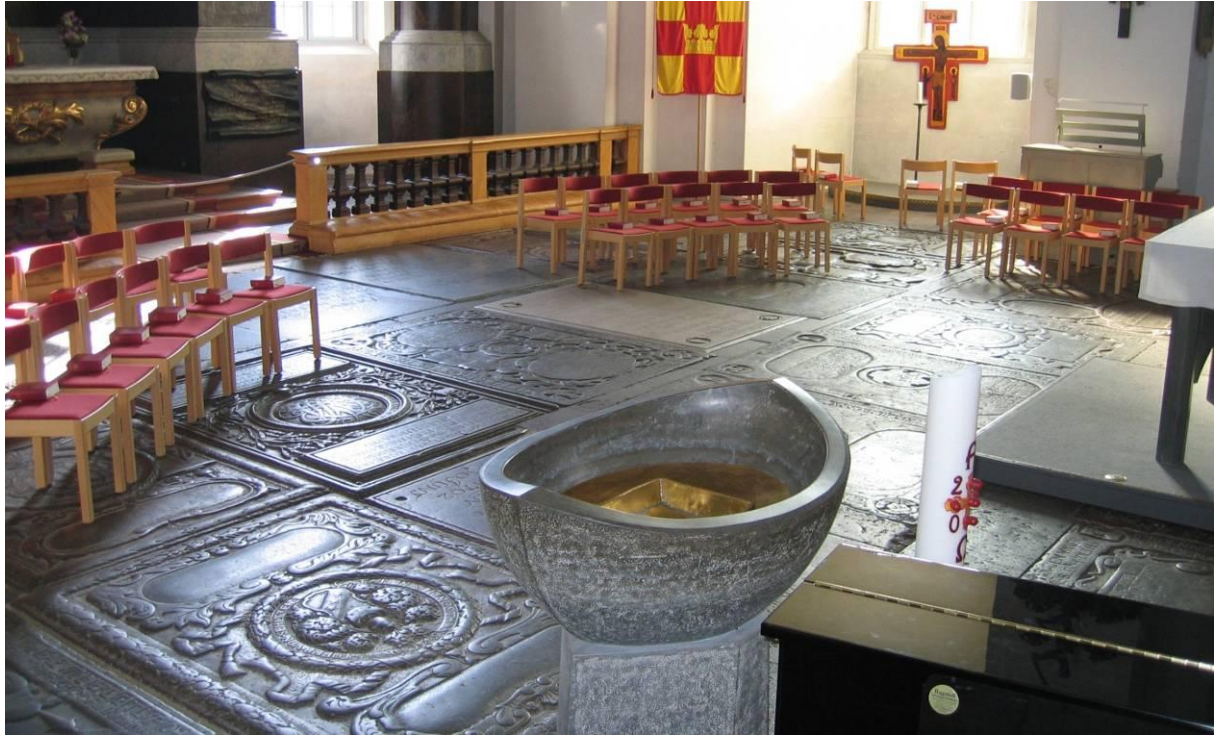
Fig. 16. Koret i Kalmar domkyrka före inre renovering. Golvstenarna är buckliga och framkomst begränsad, troligen 2007.