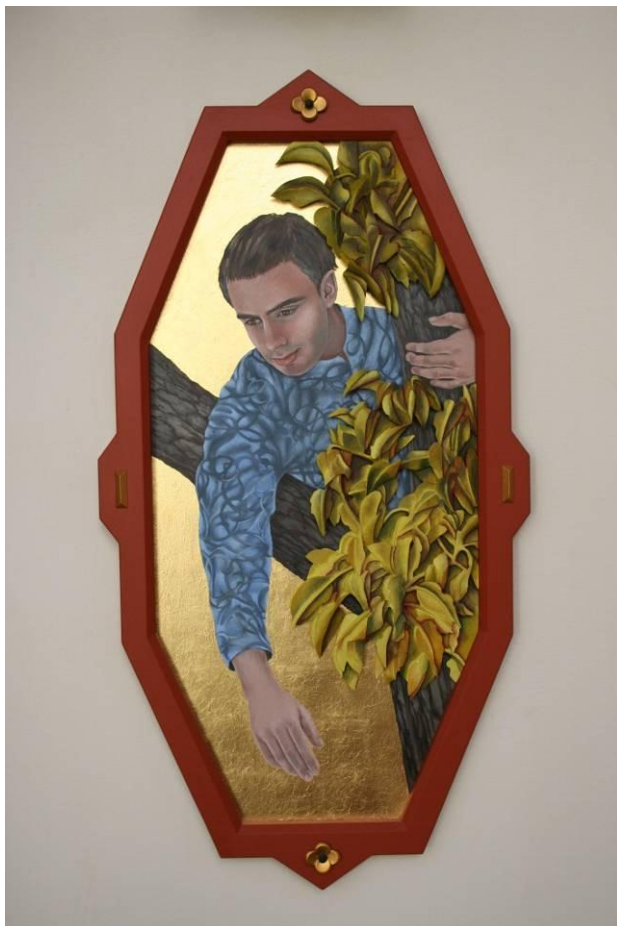
Fig. 4, 5, 6 De tre omtvistade konstverken i Sofiakyrkan har inte bara en estetisk och rumsskapande funktion, de har även en berättande och symbolisk innebörd, 2011.