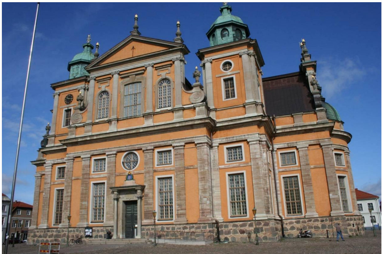
Fig. 12: Kalmar domkyrka uppförd 1660-1682. Från sydöst, 2011.