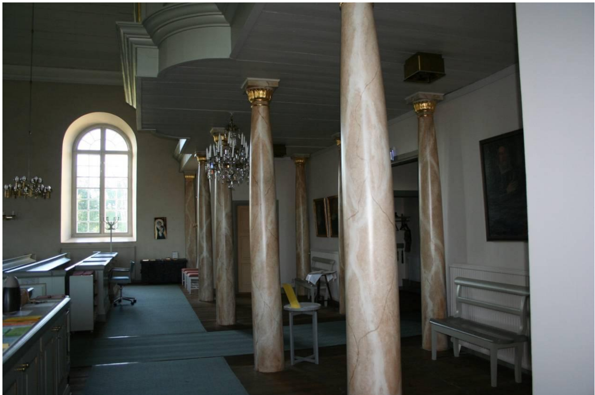
Fig. 8: Läktarunderbyggnaden i Markaryds kyrka har gett plats till nya funktionella rum, 2011.