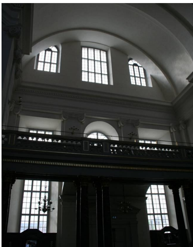
Fig. 15. Kalmar domkyrkas södra portal. De två yttersta övre fönstren är återupptagna. Mer ljus kommer in i kyrkorummet och treenighetssymboliken är åter utläsbar, 2011, Foto: C. Lantz