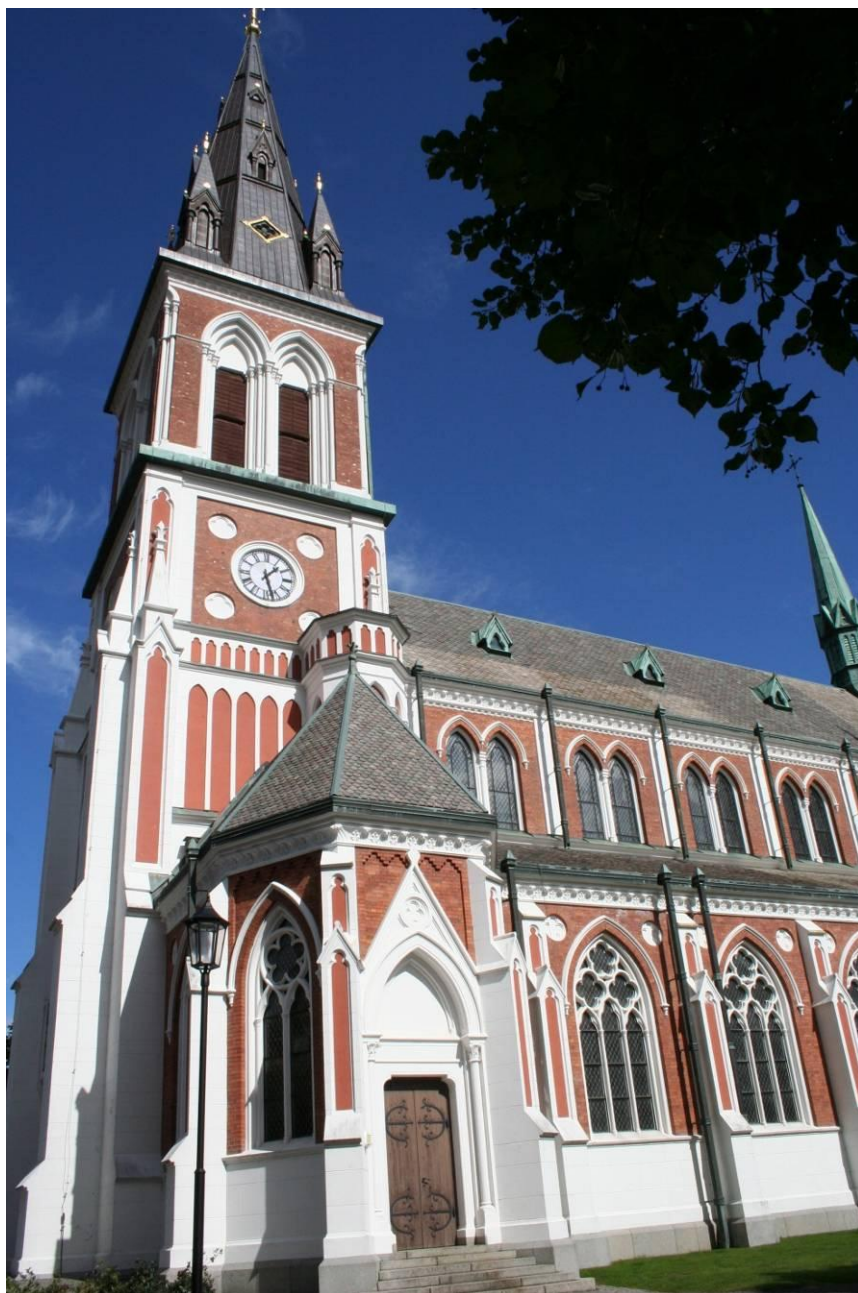
Fig 1. Sofi kyrkan, uppförd 1885-1889. Från sydväst, 2011.