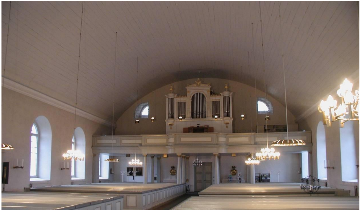
Fig. 10: Markaryds kyrka, mot väst, före renovering. Notera fönstren under läktaren, okänt år.