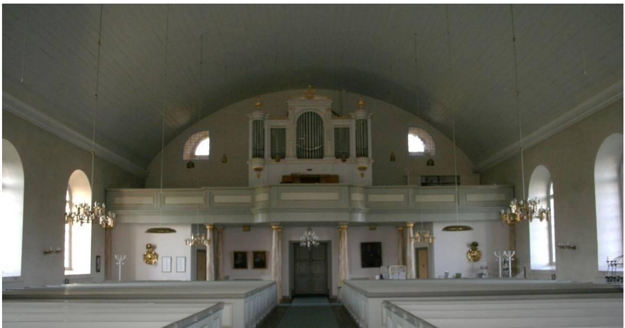
Fig. 11: Markaryds kyrka, mot väst, efter renovering. Fönstren under läktaren är numera inbyggda och finns i sakristian respektive samlingsrummet, 2011.