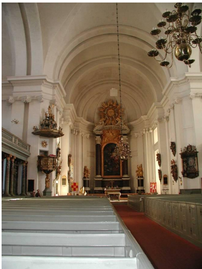
Fig. 13. Kalmar domkyrka mot öster, före inledd renovering. Fönstren i koret är igensatta okänt år.