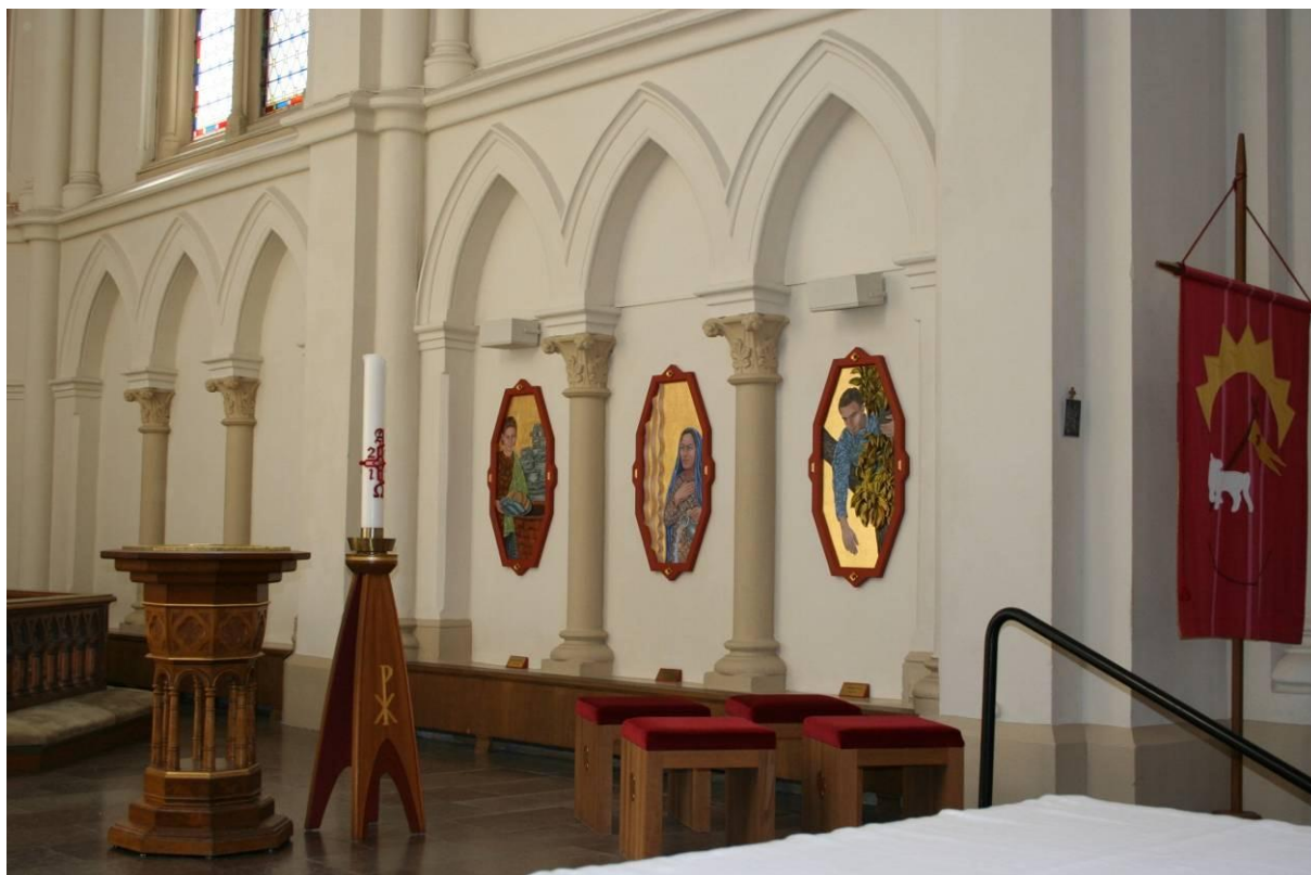
Fig 2. Sofiakyrkans kor från söder. De tre konstverken som behandlas i en juridisk process, 2011.