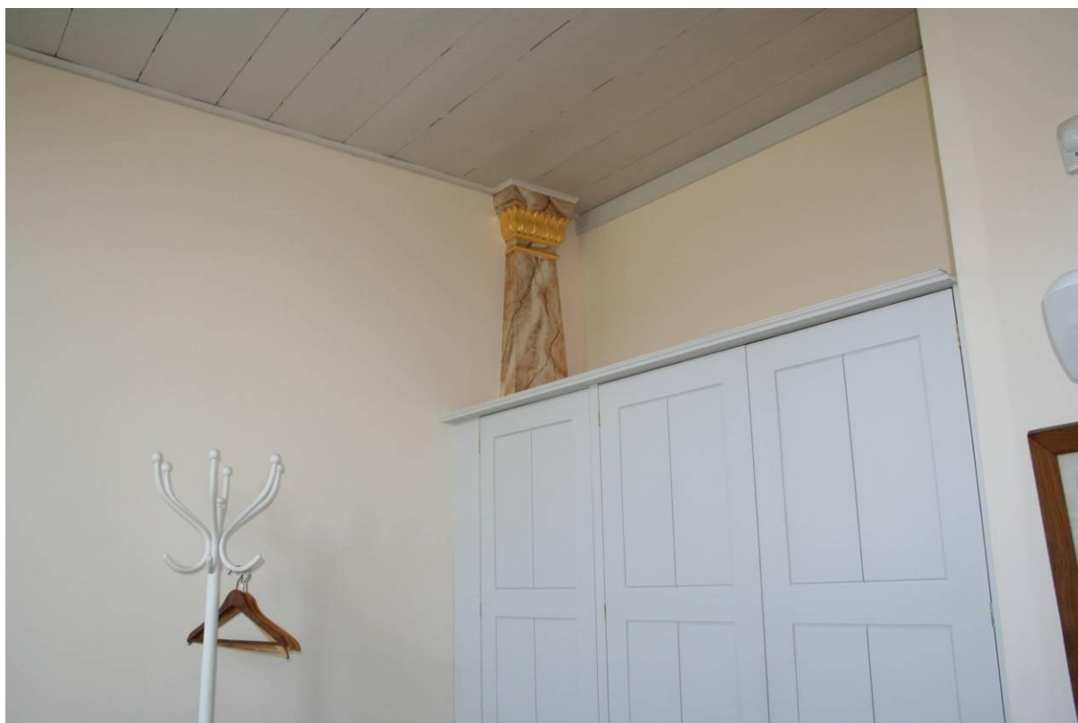
Fig. 9: Nord västra hörnet av sakristian i Markaryds kyrka. Man kan tydligt utläsa det tidigare utseendet då man sparar pilastrarna, något som de antikvariska myndigheterna önskade. På bilden syns även delar av den nya textilförvaringen, 2011.