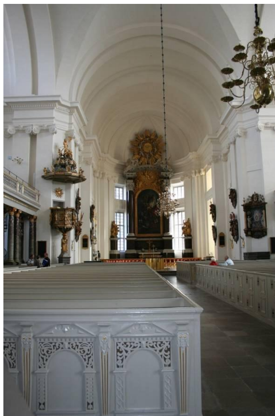
Fig. 14: Kalmardomkyrka mot öster, fönstren har åter öppnats och ljuset i kyrkorummet och koret har förändrats, 2011.