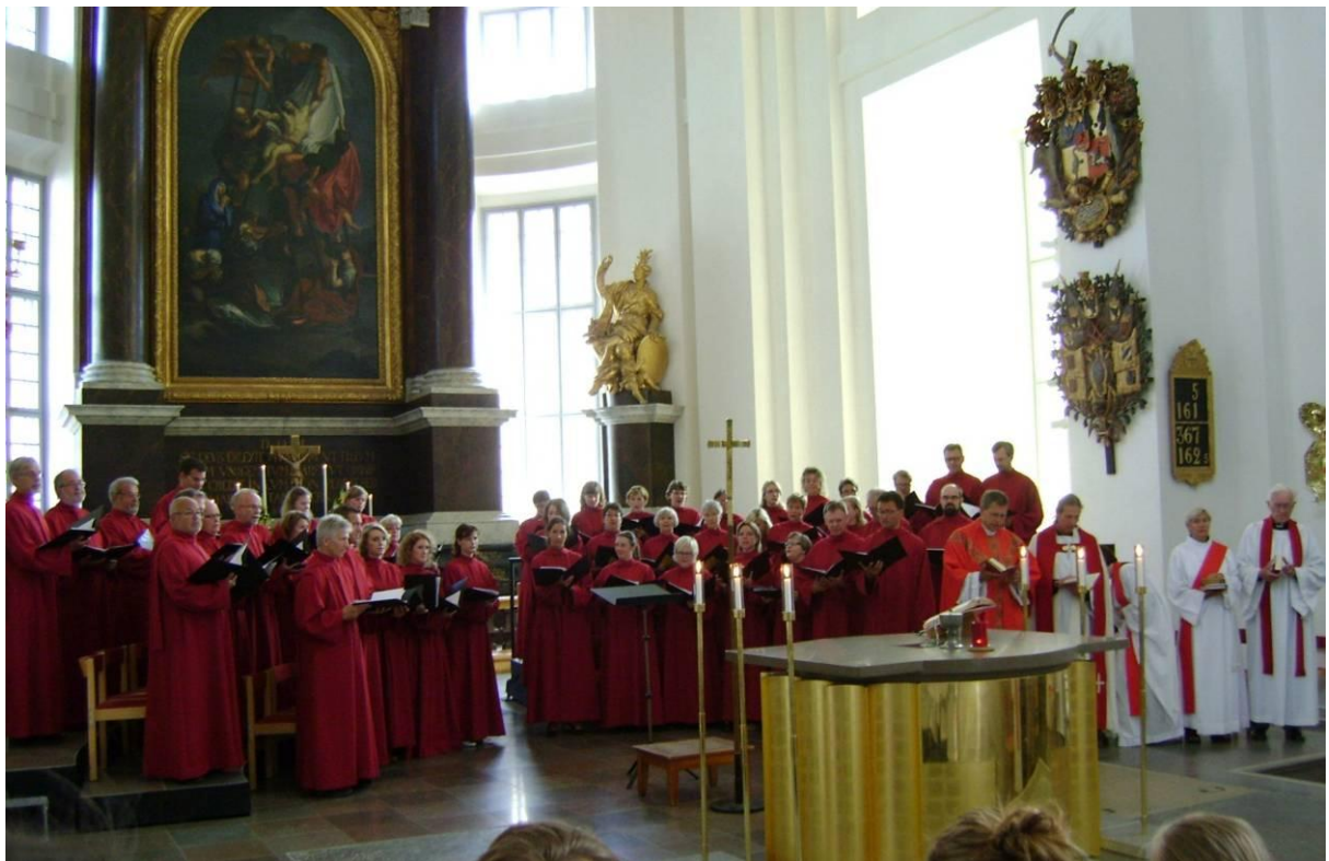
Fig. 17. Koret i Kalmar domkyrka efter första etappen för inre renovering. Bild från återinvigningen. På bilden används de nya körgradängerna, 2011.