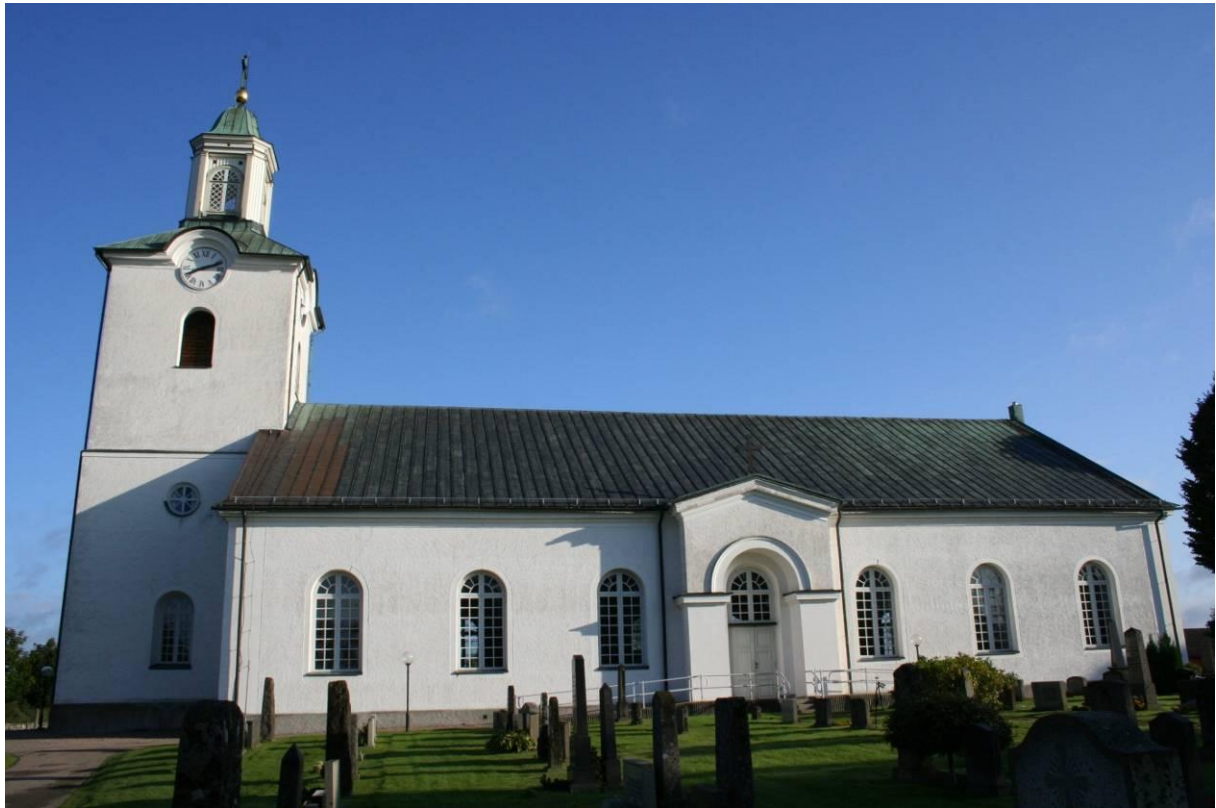
Fig. 7: Markaryds kyrka, uppförd 1853-1855. Från söder, 2011.