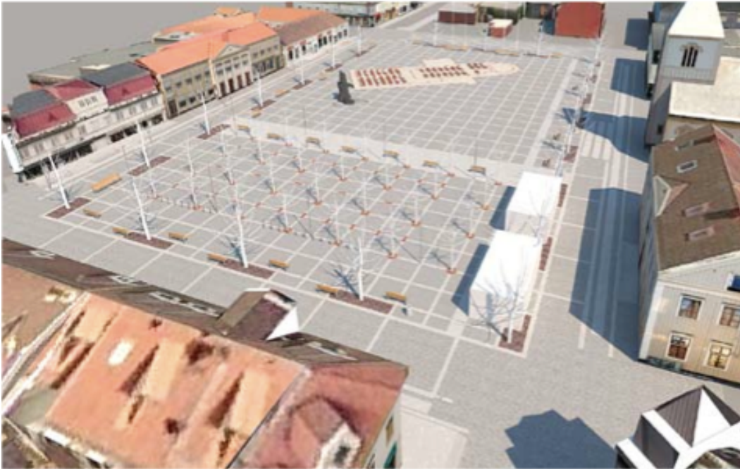
Figur 7: Skiss ur planförslaget för Stortorget ur White Arkitekter (2010) Kungsbacka Stortorg Förslagshandling

som ett sätt att värna om den historiska kontinuiteten och samtidigt sträva efter ett mer “stadsmässigt” torg, ett mål som vi nämnt tidigare. Marknaden, kyrkoruinen och den trädskulptur som finns på torget utpekade som särskiljande och identitetsskapande drag. Några ytterligare uttryck för Stortorgetets representativa roll i egenskap av en historisk symbol för centrum innehåller förslagshandlingen inte. Avslutningsvis, genom det ekonomiska rummets lins, framträder en ambition att eliminera alla fysiska och visuella barriärer som kan utgöra hinder för rörelsen till, från och mellan butiker i anslutning till Stortorget.