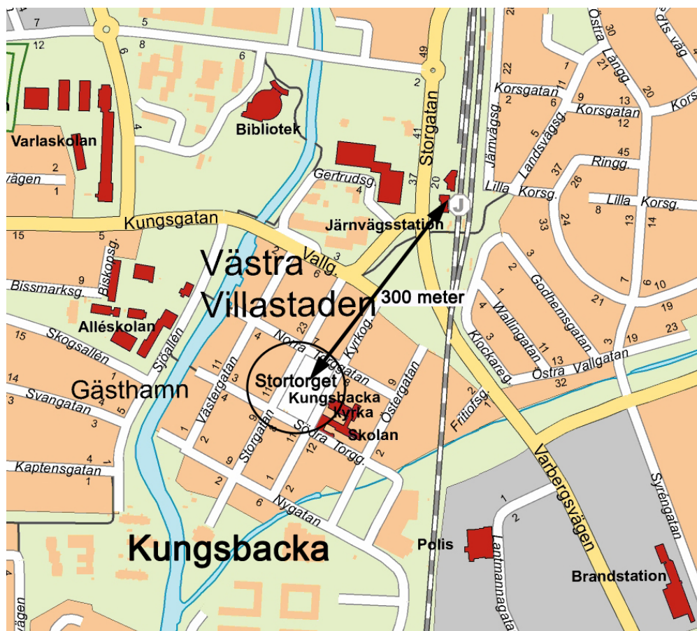
Karta 2. Stortorget's lokalisering i Kungsbacka

Handläggaren för planprocessen för Stortorget menar att omvandlingen av torget har varit omdiskuterad och legat i startgroparna under närmare tjugio års tid på grund av motsättningar angående torgets utformning och syfte (Graad 2011). I det program från 2008 som föranledde planförslaget från White Arkitekter beskriver man Stortorget som “Innerstadens hjärta”, och menar att “en helhetslösning för en framtida användning och upprustning av torget” måste tas fram för att torget ska kunna fortsätta att vara stadens viktigaste mötesplats (Kungsbacka kommun 2008). Under vintern 2011-2012 är arbetet i gång och det omvandlade Stortorget väntas invigas i maj 2012 (Kungsbacka kommun 2011g).