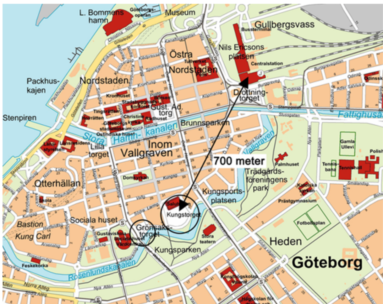
Karta 1. Kungstorget och Grönsakstorgets lokalisering i Göteborg Källa: Lantmäteriet, författarnas ändringar

Sedan flera år pågår en medveten miljöupprustning av City, som syftar till att skapa en trygg och angenäm stadsmiljö för människor att vistas och som gagnar handel och verksamheter i City (Göteborgs stad 2011c).