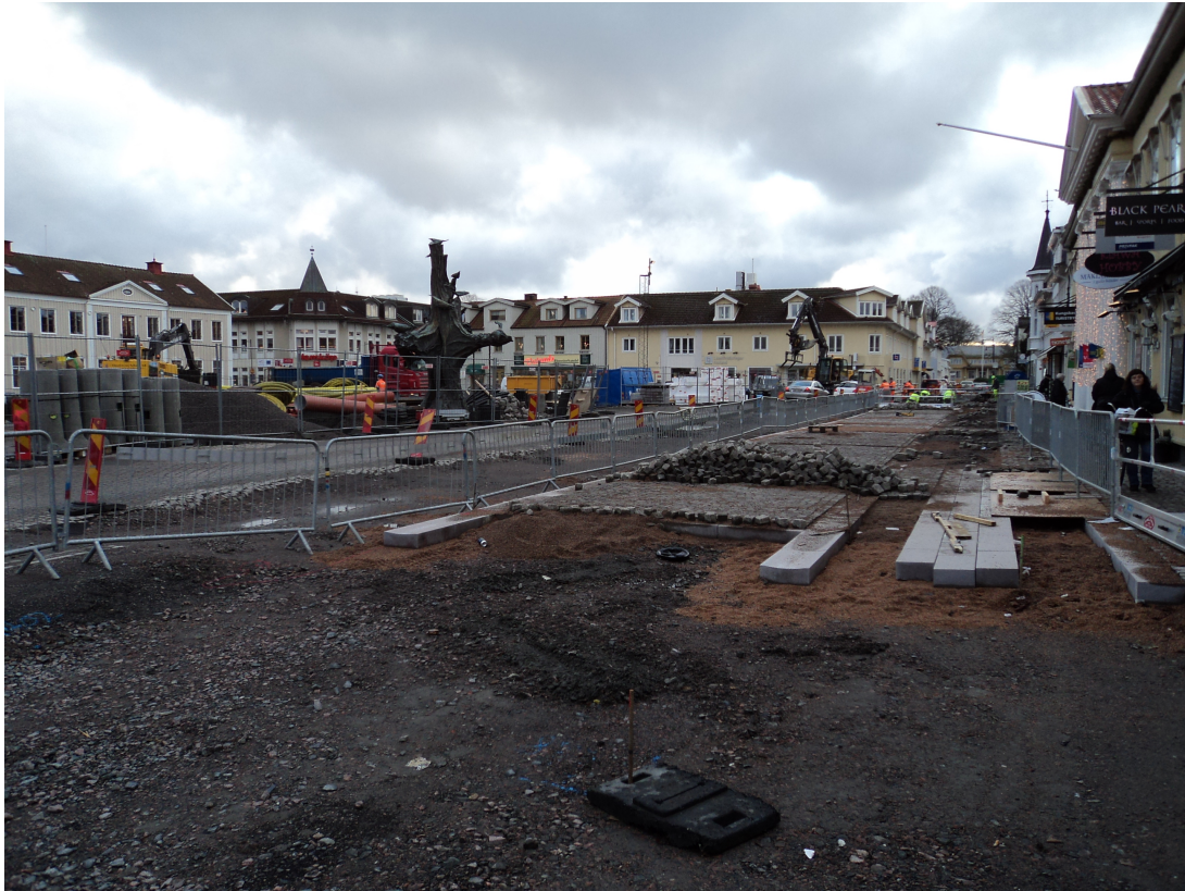
Figur 4: Foto från Stortorget i december 2011