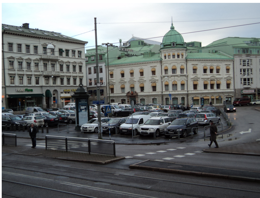
Figur 1, 2, 3: Två foton från Kungstorget och ett från Grönsakstorget i december 2011