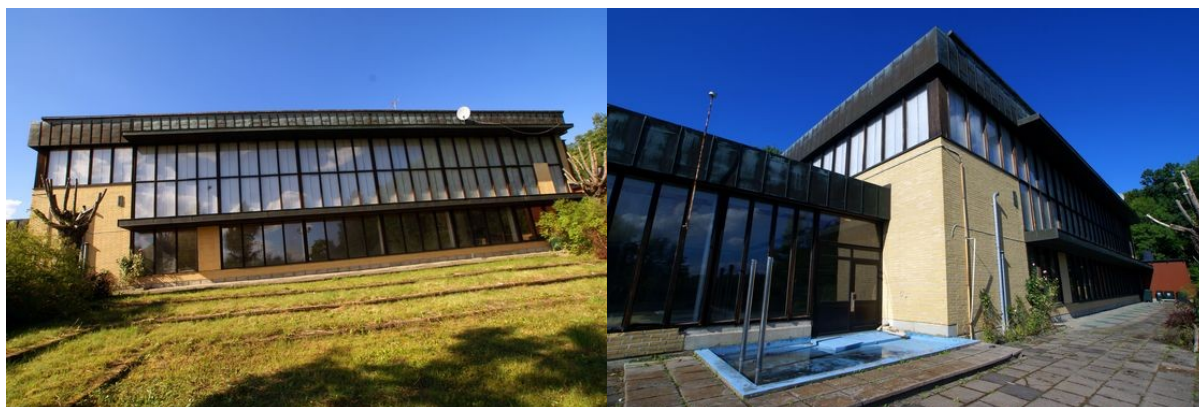
Fasad på baksidan