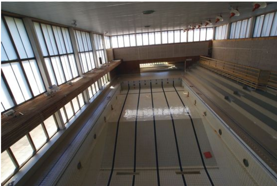
Utsikt över stora bassängen

Jag vill jämföra informanternas minnen från simhallen med Jörnmarks bilder av den för att se vad det finns för likheter och skillnader i framställningarna. Jag har varit intresserad av hur informanterna minns simhallen. Är det i positiva ordalag eller negativa? Flera av informanterna har använt badhuset som mest när de var barn och gick i skolan. Alla har varit i badhuset med skolan. Dessa besök har upplevts väldigt olika. Jag har bett dem berätta ett minne från simhallen och nedan blandas de med bilder från den stängda simhallen.