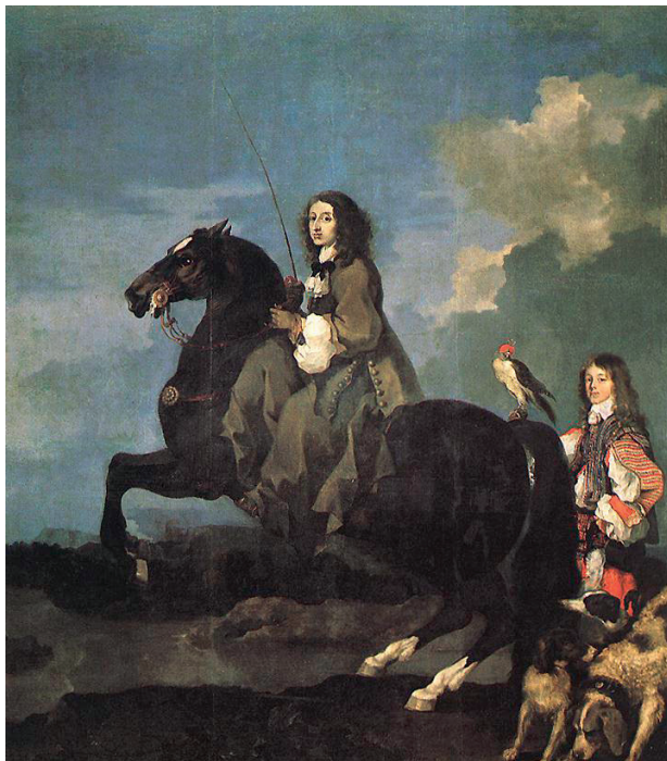
Ill. 1.1 Drottning Kristina till häst, av Sébastien Bourdon 1653, Museo Nacional del Prado i Madrid.