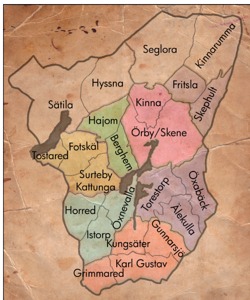
Illustration 4:1. Socknar i Marks härad