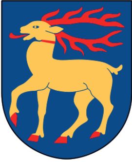
Illustration 6.2 Ölands landskapsvapen.

Att ön behöll frilevande stammar av klövvilt in i tidigmodern tid kan sannolikt tillskrivas det faktum att djuren måste ha skyddats i tidigare skeden. Det går anars inte att förklara den relik av vildsvin som överlevde på ön fram till 1688. 864 Medan arten utrotades på det vida större fastlandet, vilket landskapslagarna genom att inte nämna arten åskådliggör, överlevde den på Ölands kringgårdade och relativt tätt befolkade yta. Vad som kan anas är en repression och en ambition att söka undertrycka allmogens jaktutövning långt tidigare än i de lagar eftervärlden kan se.