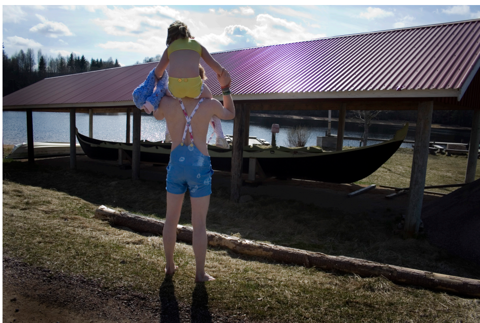
Världens Vackraste By , 2008.

Förutom Dalarna har jag när det gäller ytornas känsla i bollarna och materialen i sig inspirerats av nordisk forntid och mytologiska berättelser. Jag tycker det däremellan finns en nära koppling till kulturen som jag upplever den i Dalarna och dess strävan efter dåtid och oföränderlighet. Som en saga om dalkarlen, den rediga, starka, rakryggade mannen.