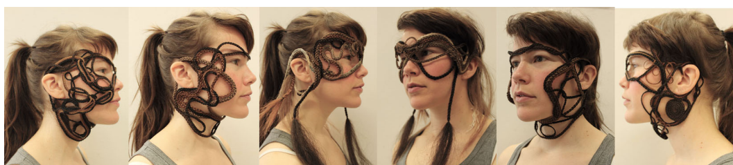
Masker: från vänster 2,3,4,4,3,2

Maskerna är tillverkade av flätat syntetiskt hår och lintråd. Det har blivit fem masker, varav en rätt kvickt hamnade som ornament på en av bollarna. Just den var tillverkad helt i flätad lintråd och saknade både styrsel och det dramatiska uttryck de andra har. Tre av maskerna är helt flätade i hår och den fjärde i en blandning av hår och lintråd. Det skiljer inte så mycket i uttryck mellan maskerna mer än att de har fokus på lite olika platser i ansiktet eller på halsen. För att göra maskerna har jag använt mig av ett dockhuvud i gummi som jag modellerat och nålat flätorna på för att sedan fästa dem samman med stygn.