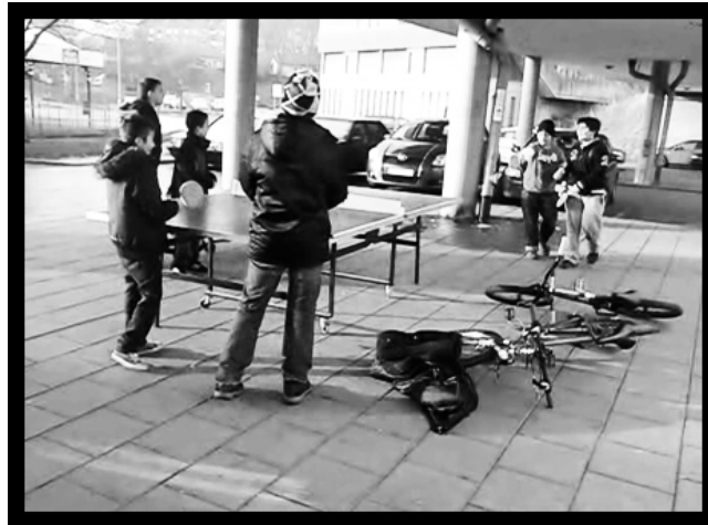
Bild 4. Aktivitet vid pingisbordet