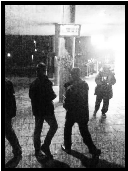
Bild 3. Aktivitet vid darttavlan

klev ur spelet och drog vidare. Darttavlan sattes upp vid tre olika tillfällen där tiden den satt uppe varierade mellan 90 till 160 minuter. Nästa markör som placerades ut var ett pingisbord. Bordet stod på torget under fem timmar och under dessa timmar var det intensiv aktivitet. Det spelades med fyra rack och en boll och det uppstod en naturlig turtagning, där de olika deltagarna samsades om utrustningen. Kreativiteten flödade, rundpingis varvades med småturneringar och individuellt spel alternerades med lagspel om två. Samtliga tillfällen dokumenterades genom att jag filmade med min mobilkamera. Nedan två bilder från arbetsprocessen.