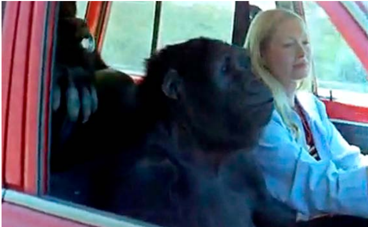
Koko: A talking gorilla.

För länge sedan hade jag inga begränsningar. Jag kunde göra vad jag ville, det handlade bara om att bestämma sig. Jag minns att jag brukade jag gå runt till folk och säga "haha jag är fri att göra vad jag vill med mitt liv. Och det är du med!"