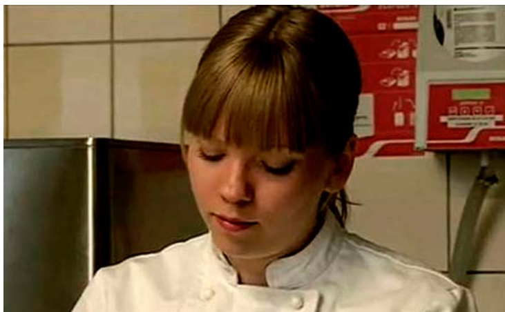
Programmet Sverige, SVT 2010.

Jag undrar därför om du vill se lite av det jag filmat?