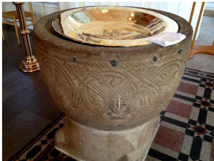
Dopfunt Höörs kyrka. Blyplomberade relikier

Det var väldigt behagligt att förutsättningslöst arbeta utan att ens kunna ana vad slutresultatet skulle bli. Ett tag arbetade jag med hängande plåtvolymer med lerkapslar som på ett nästan rituellt sätt monterades i formen permanent. Ungefär som relik i form av ”flisa från Jesu stortå” och ”färgskav från Mose sandal” monterades i medeltida dopfuntar och plomberades för evigt med bly. Vid en närmare fundering, passade sig inte detta sätt att låsa fast objekten riktigt med vad jag ville uttrycka. Tanken var vid den här tidpunkten att visa samlandet på tre olika sätt. Det pragmatiska, det maniska och det djurlika. I sin pragmatiska form där objekten varsamt och noggrant packas ner i ett skyddshölje för att sedan ställas undan. Det maniska, där det finns en slags desperation och naivitet. Och det djuriska som blir något väldigt instinktivt.