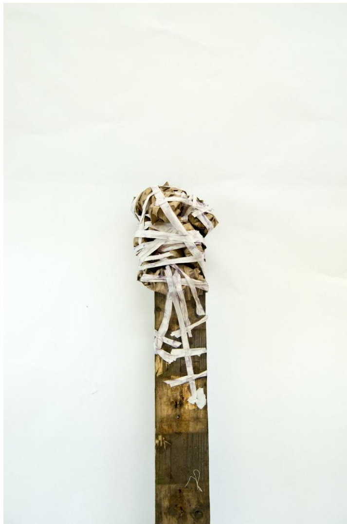
Djurlikt sätt att samla? Ett svalbo, en myrstack, en bikupa.