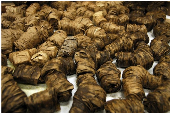
Massan av objekt med okänt innehåll.

Under många år samlade min far på vinkorkar. Han hade en vision om att sex hundra vinkorkar skulle skapa flytvästen han alltid velat ha. Tyvärr så hann jag in boxen göra sitt intåg och planerna gick i stöpet. Själv samlar jag på gamla tepåsar för att jag tror att jag kommer behöva dem till något liknande någon gång. Då finns det ju en intention att med samlingen någon gång uträtta något ”viktigt”. Men en kapsyl eller frimärkssamling då? Är det i görandet som drivkraften finns då?