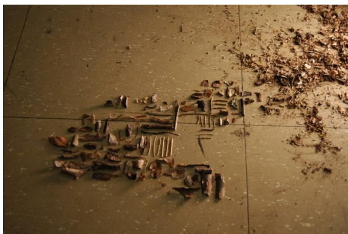
En organiserad skräphög