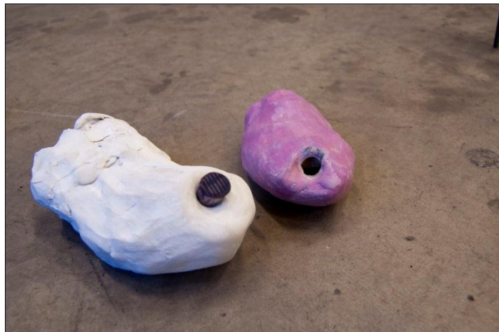
Lerkapslar innan montering i större form