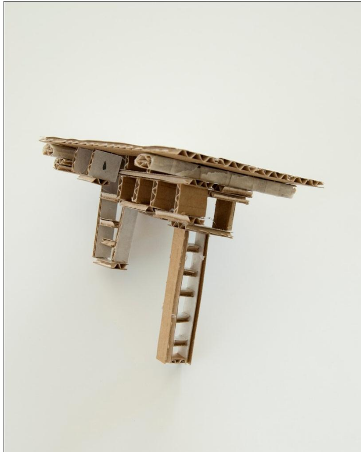
En av flera pappmodeller till plankkonstruktionen.