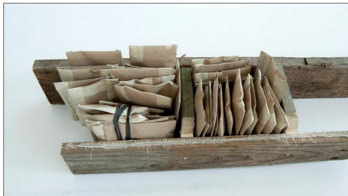
Papperskapslarna förändrades under processen till ett slags paket.