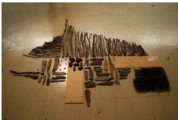
Lite sorterad natur