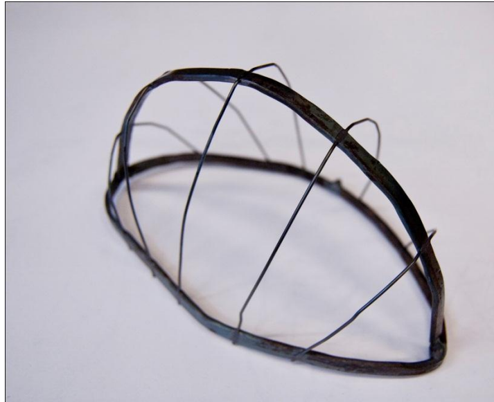
En av de tidigare kapslarna, som var tänkt att plomberas fast vid en större form.