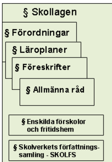
Figur 1: Förhållandet mellan skolans styrdokument. 40

Eftersom Sverige Rikes Lagar självfallet gäller även för skolan gör även diskrimineringslagen det. Därför kan skollagen sägas utgå från diskrimineringslagen i fråga om likabehandlingsarbetet. 41