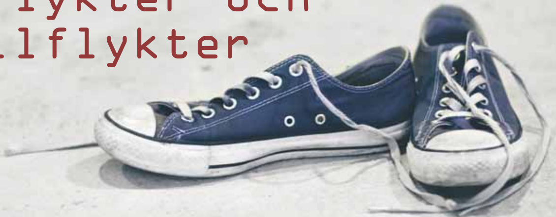
Ylvalis Skor.