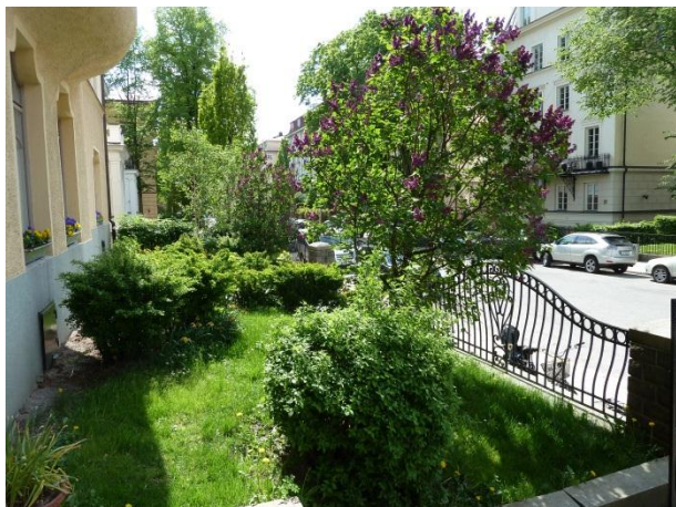
Figur 13. Bevarad förträdgård vid Villagata i Stockholm.

Fastighetsförvaltare spelar en mycket viktig roll vid bevarandet av stadsträdgårdar då de ansvarar för utformningen av gårds- och grönområden i anslutning till husen. Beroende på ambitionsnivån kan trädgårdarna utgöra ett viktigt komplement i bostadsmiljön eller försummas.