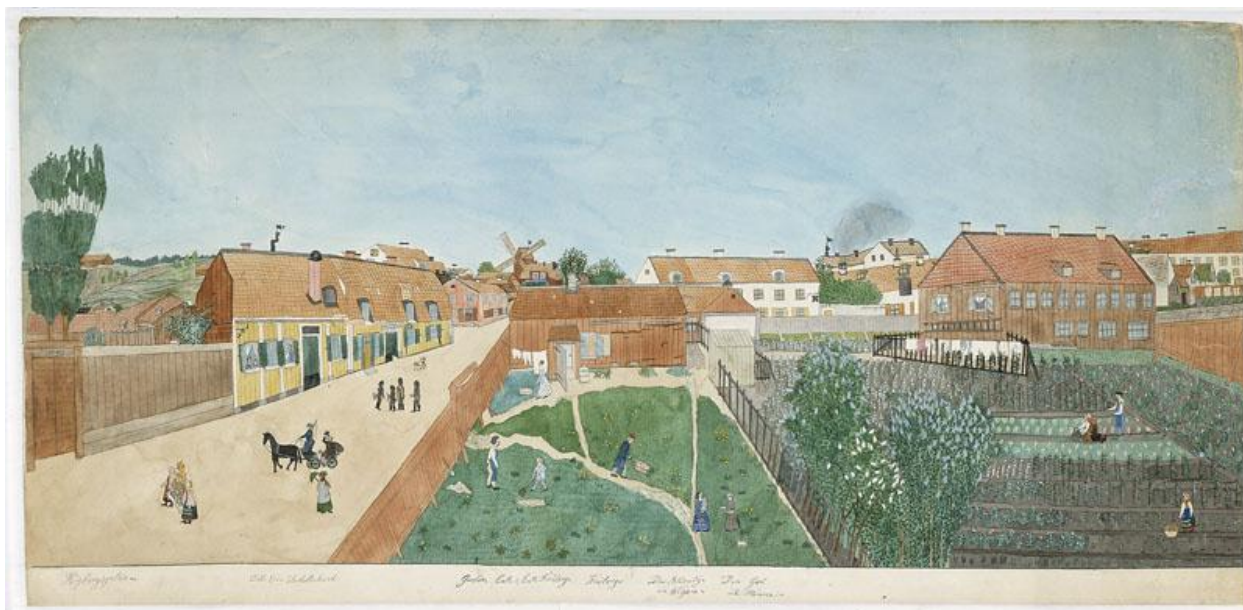
Figur 4. Akvarell föreställande Högbergsgatan ritad av Josabeth Sjöberg. I malmträdgården syns längst till vänster en trädgårdsmästare och två trädgårdskullor i arbete. Odlingarna består bland annat av kål och morötter (Flinck 1994, s. 216).