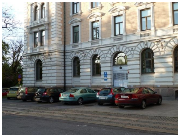
Figur 14. Exempel på en förträdgård i Göteborg som byggts om till parkeringsplats. Den är en tydlig kontrast mot trädgården till vänster.

AB Stadsholmen är Stockholms stads fastighetsbolag och ansvarar för förvaltningen av äldre, kulturhistoriskt värdefulla fastigheter. Till bolagets policy finns riktlinjer för att behålla de tillhörande trädgårdarnas karaktär och att alla åtgärder ska ske med minsta möjliga ingrepp. Skötseln fastställs efter de individuella trädgårdarnas behov utifrån historiskt källmaterial, fältstudier och dagens behov. Utifrån dokumentationerna görs sedan en vårdplan för varje område med konkreta anvisningar. Som en del av sin verksamhet har Stadsholmen tagit fram referensträdgårdar. Det är anläggningar vilka ska representera olika tidsepoker, samhällsklasser och stilar. De ska också visa på olika sätt som trädgårdar kan både bevaras och förvaltas. Referensträdgårdarna består av skiftande miljöer vilka