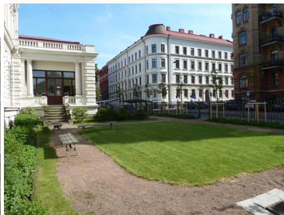
Figur 24. Wernerska villan efter rekonstruktionen med de återfunna grusgångarna. I trädgårdens borte del syns cykelställets skärmtak.