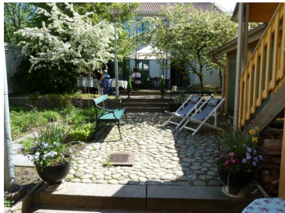
Figur 27 och 28. Blomsterkrokens trädgård idag. Innergården används numera som uteservering till caféet Blomsterkroken .