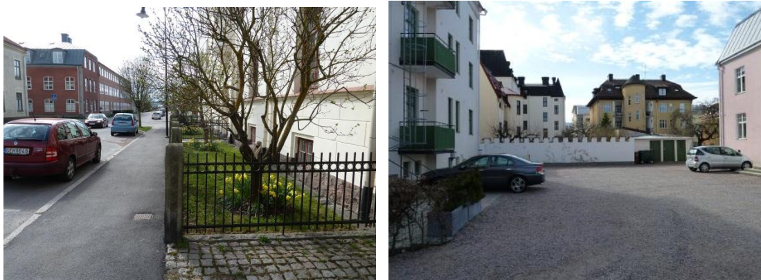
Figur 17 och 18. Förträdgårdarna längs Fruängsgatan har på framsidan av husen bevarat sitt äldre utseende. På baksidan är förändringarna större och några av de tidigare trädgårdarna har ersatts med parkeringsplatser.

På baksidan av husen inne i kvarteren har det ursprungligen funnits stora trädgårdar med plats för bland annat fruktodlingar (Södermanlands museum 1979, s.70). Här har det skett en större förändring och delar av trädgårdarna har blivit sten- eller grusbelagda för att möjliggöra för bland annat parkeringar. Dock finns det fortfarande hus vilka fått behålla även den inre trädgården.