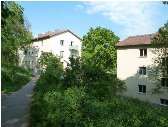
Figur 9. Under 1930-talet fick bebyggelsen en annan relation till naturen. Istället för trädgårdar anlades husen friare i landskapet. Bilden föreställer kvarteret Stålet längs Tengdahlsgatan på Södermalm i Stockholm och uppfördes i slutet av 30-talet.

I samband med funktionalismens genombrott under 1930-talet förändrades synen på de tidigare trädgårdsmiljöerna. Trädgården var inte heller längre den rekreationsplats som den varit under början av 1900-talet utan endast ett nyttoinslag.