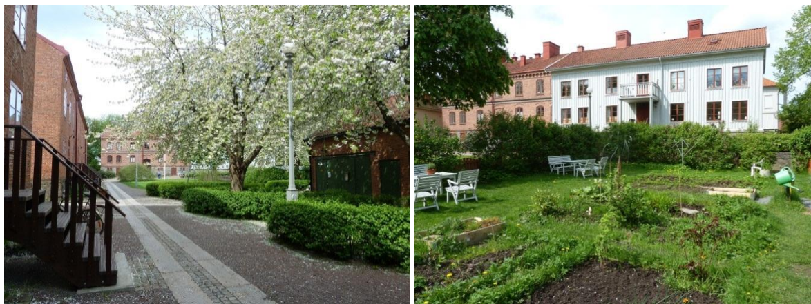
Figur 29 och 30. Innergården till de gamla arbetarbostäderna i Klippans kulturresevat består idag av en blandning av gemensamma grönytor och små odlingslotter för de boende.

Liknande projekt genomfördes under samma period i andra områden, däribland i Kungsladugård i Göteborg där ett antal landshövdingehus från 1920-talet kompletterades med nyanlagda odlingssträdgårdar (Horgby & Jarlov 1991, s.127-129)