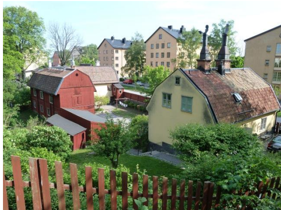
Figur 20. Peter Fagges krog vid Gaveliusgatan. Bakom husen breder en stor trädgård ut sig inåt tomten.