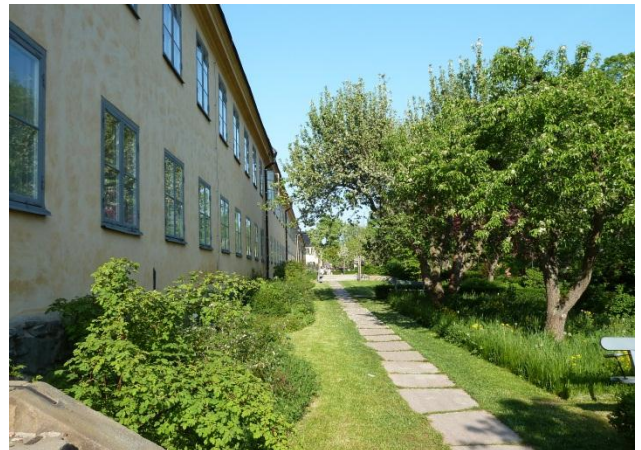
Figur 21 och 22. De gamla trädgårdar och murarna har restaurerats för att återskapa 1800-tals karaktären. Vid planteringen har växter populära för tiden används.

Trädgården restaurerades av landskapsarkitektkontoret Landskapslaget på uppdrag av Statens fastighetsverk. Vid restaureringen bevarades de stora strukturerna i trädgården som stråk, form och funktion. Det samma gällde detaljer såsom terrassmurarna vilka är karaktärsbildande för området. Kartor från slutet av 1800-talet har fått utgöra förebilden vid restaureringen som dock endast inbegrep trädgården längst västerut. Den restaurerades efter de gamla formerna medan de övriga utformades utifrån en friare tolkning av 1800-talets former (Landskapslaget 2011). Den friare utformningen av den tidigare trädgården kan ses som en ny- eller omgestaltning. Den fria tolkningen av 1800-talets former kan även kallas för ”fri förnyelse”. Ett begrepp som myntades av landskapsarkitekten Sven-Ingvar Andersson (se nedan under ny- eller omgestaltning ).