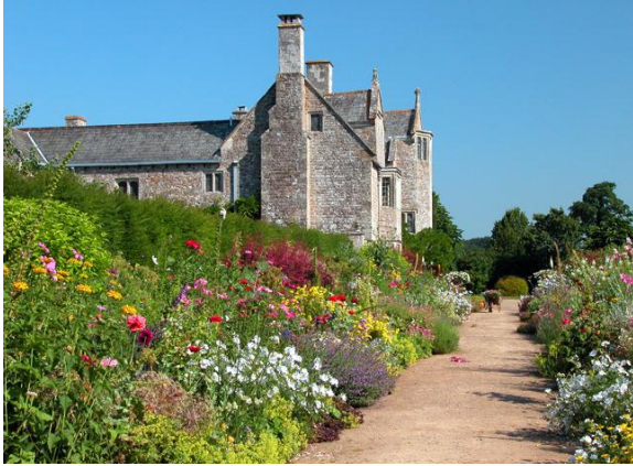
Figur 11. Cadhay, Devon. Gods från 1500-talet. Till trädgårdsanläggningen finns bland annat fontäner, gångstråk och muromgärdad trädgård.

Tillhör anläggningen en av de två högsta kategorier kan ägaren söka bidrag från English Heritage vid vård och restaureringsarbeten. Det krävs dock att det upprättas en långsiktig vårdplan till trädgården som fastställer dess historiska värden och syftet med de finansierade vårdåtgärderna. Trädgården måste dessutom hållas öppen för allmänheten under delar av året för att få bidragsstöd (Ahrlund 1996, s 165).