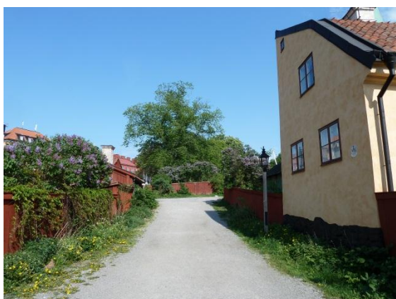
Figur 19. Längs Bergsprängargränd i Vita bergen förstärks områdets ålderdomliga karaktär med hjälp av höga staket och praktfulla trädgårdar.

Området förvaltas idag av det kommunala fastighetsbolaget Stadsholmen AB. Stadsholmen har tagit fram vård- och skötselprogram för sina trädgårdar och gårdsmiljöer inom alla sina fastigheter. De fastigheter som har flera hyresgäster får sina trädgård- och gårdsmiljöer underhållna av ett trädgårdsföretag medan enfamiljshusens hyresgäster själva sköter sina trädgårdar. Med hjälp av trädgårdsantikvarien Maria Flincks inventering av Stadsholmens trädgårdar har vårdplaner utformats för att bevara trädgårdarna. Planerna består dels av generella riktlinjer och dels av konkreta skötselråd (AB Stadsholmen 2002, s. 35-26)