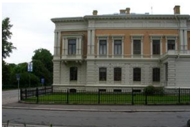
Figur 23. Wernerska villan 2007, före rekonstruktionen. Trädgården bestod vid denna tid enbart av en gräsmatta.

Rekonstruktionen av förträdgården inleddes 2007 med en historisk dokumentation och arkeologisk undersökning av trädgården, utförda av trädgårdsantikvarien Inger Ernstsson (02LANDSKAP 2007). Genom marschaktningar i trädgården återupptäcktes de gamla grusgångarna, vilka befanns vara i tillräckligt gott skick för att kunna återanvändas. Utifrån den trädgårdsarkeologiska undersökningen utformade arkitektkontoret 02LANDSKAP år 2008 en rekonstruktion av trädgårdens tidigare utseende. Gamla fotografier från sekelskiftet 1900 fick utgöra den visuella förlagan till rekonstruktionen tillsammans med den arkeologiska undersökningen. Då det inte gick att klargöra vilka växter som funnits i planteringarna beslutades det att prioritera förträdgårdens fasta strukturer. Växterna valdes istället ut efter vilka som var vanliga vid byggnadens uppförande, en vanlig kompromiss vid återskapandet av historiska trädgårdar (Ernstsson 2008, s. 22-23).