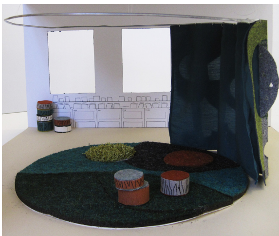
Sagorum, bortdragen textil.