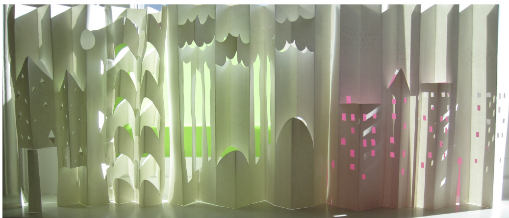
Skiss i papper.

Mycket tid lades på att hitta en bra form för textilen. Skissandet med att skära i papper varvades med att testa färger och material för att sedan återgå till grundskissandet igen. Flera varv gjordes för att hitta det bästa resultatet. De bästa delarna plockades ur varje skiss och slutprodukten tog så småningom form.