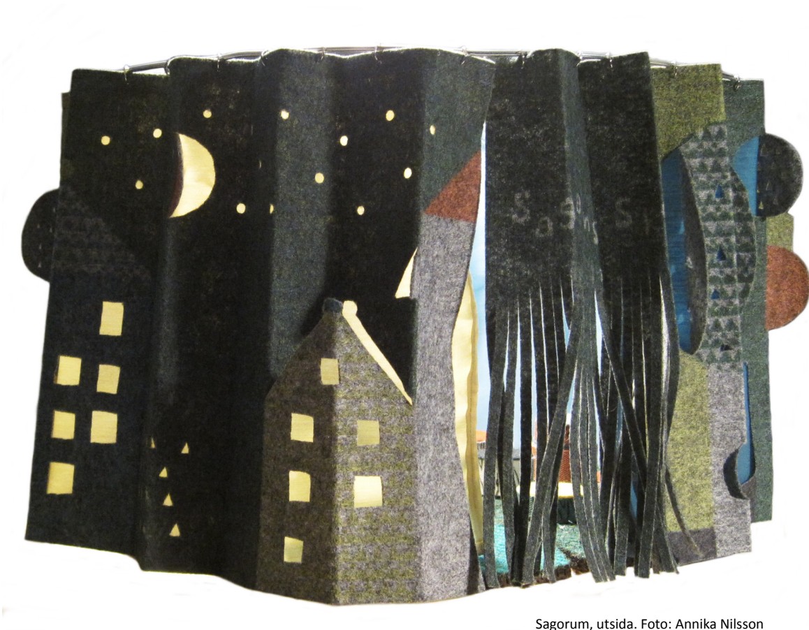
Sagorum, utsida.