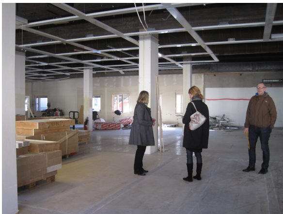
De nya lokalerna.