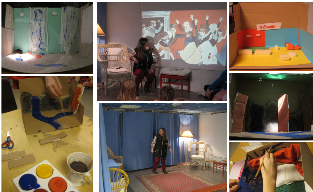
Workshop Lidköpings Bibliotek.