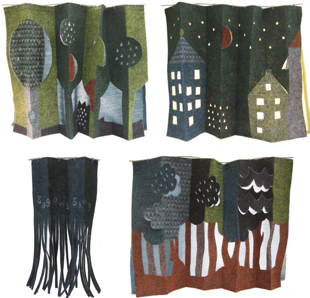
Sektioner att sätta ihop efter behov.

Sagans skog är ett koncept som idag består av fyra sektioner. Varje sektion är en veckad textil som antingen kan sättas samman med flera sektioner för att bilda en textil vikkvägg eller stå för sig själv. Detta flexibla koncept skapades för att låta kunden välja efter eget behov. Konceptet passar flera miljöer, främst offentlig miljö då prisklassen är lite högre men skulle även kunna användas för hemmiljö. Det kan användas som rumsavdelare, draperi, skärmvägg eller till att skapa ett rum i rummet med och hängs enkelt upp på en skena i taket. Konceptet består av tre delar med olika motiv och en öppning som med fördel kan användas om man väljer att skapa ett rum i rummet. Konceptet riktar sig till Arkitektkontor som i sin tur kan ta in produkten i inredningar. Den riktar sig också direkt till bibliotek, skolor, förskolor och andra platser där det finns behov av flexibla rum för barn.