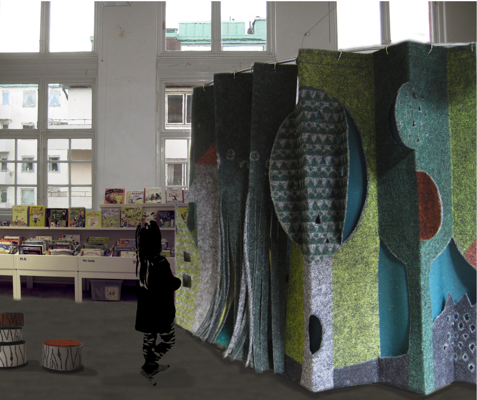
Sagorum, utsida. Kollage: Annika Nilsson