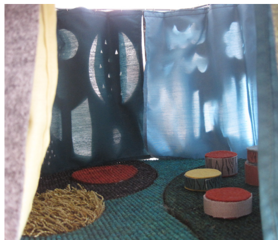
Sagorum, insida.