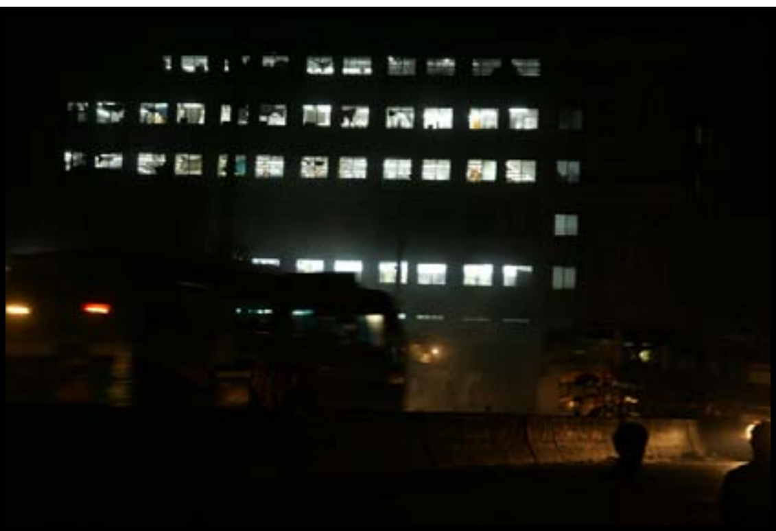
Vägen till Gazipur kantas av fabriker. Här vittnar lysrörsbelysningen om ett sent kvällspass.

Det är förbjudet att övertala en arbetare att gå med i eller inte gå med i en fackförening under arbetstid. ■