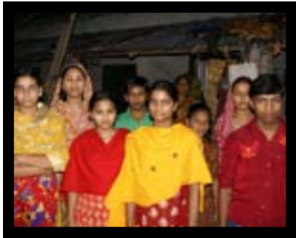
Några arbetare från Garib & Garib och deras barn.