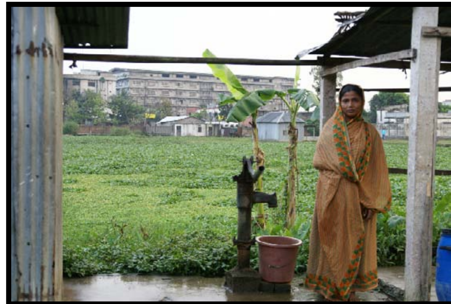
I Garib & Garib arbetar ungefär 3 500 människor med att sy kläder till bland annat H&M. Fabriksarbetarna bor ofta bara några hundra meter från sina arbetsplatser.

kan se helt annorlunda ut. Folk blir sjuka av det här, att arbeta så mycket. En annan som suckar när han får höra om Garib & Garib-arbetarnas arbetsvillkor är Patrick Itschert, generalsekreterare för det internationella klädarbetarförbundet. – Då är det ett problem, det är inte lagligt. En kontroll om året räcker inte. Man borde arbeta med fackföreningar, som ser till att arbetsförhållandena är bra på en daglig basis. Han ser mörkt på industrins utveckling och säger att det är många som inte har uppfyllt de kraven som ska gälla. – Förutom att barnarbetet minskat står det stilla. Det har inte blivit några stora förbättringar när det gäller till exempel rättigheter och overtid. Det rör sig inte. >>>