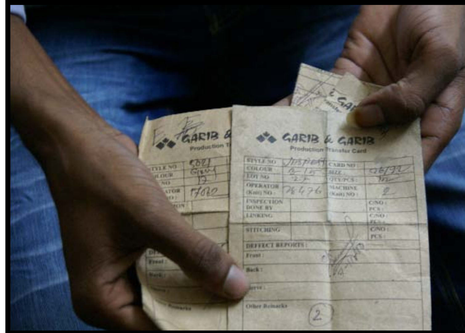
Akid vågar inte visa sitt ansikte. Han är rädd för att få sparken. Han har arbetat fyra år i Garib & Garib och de senaste tre månaderna har han arbetat utan att ha en enda ledig dag för att klara leveranserna.

DE SÄGER ATT DE BÖRJAR ARBETA klockan åtta på morgonen och att de arbetar till klockan 23 alla dagar i veckan utom två, då de arbetar till klockan 21. De kallar det inte