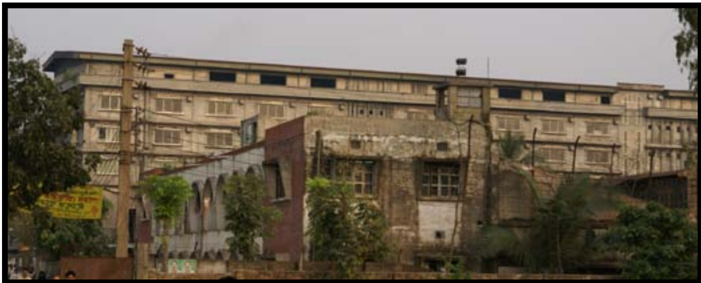
Garib & Garib nekades att producera för den amerikanska butikskedjan Walmart. Fabriken fick kedjans näst sämsta betyg i kontrollerna. Även svenska Lindex har kontrollerat fabriken. En etta på en skala 0-4, blev resultatet.