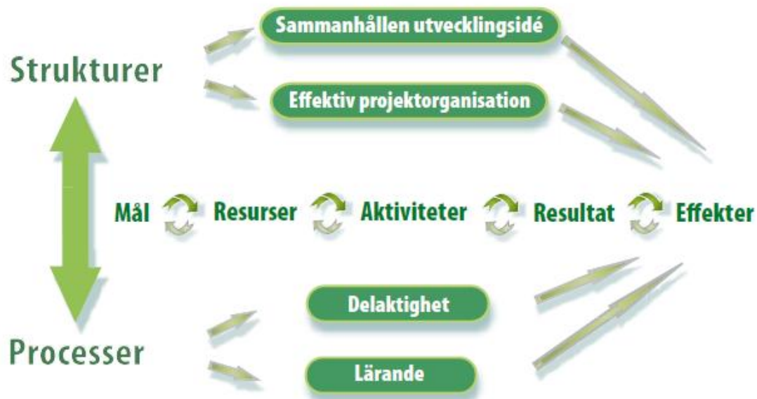
Figur 2: Analysmodell för hållbart utvecklingsarbete.

I en forsknings- och utvecklingsrapport som har utförts på uppdrag av ESF har fem projekt studerats där resultat och metoder har lyckats leva kvar i den ordinarie verksamheten. För att svara på frågan om vad som har gjort implementeringsprocessen lyckad i dessa fall använder författarna sig av den här analysmodellen:(Sävenstrand och Florén 2011)