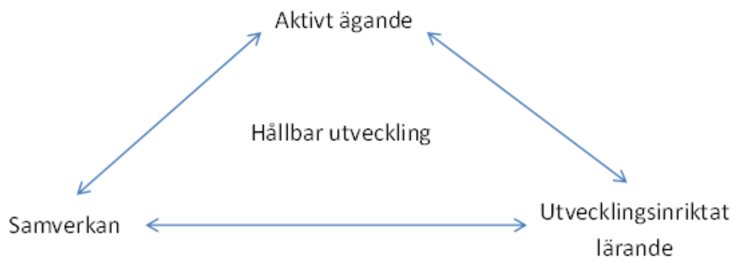
Figur 1: Mekanismer för hållbart utvecklingsarbete.

Brulin och Svenssons (2011) har skrivit en som bok handlar om hur ett hållbart utvecklingsarbete kan organiseras. Deras studier har precis som våra varit inriktade på stora, offentligt finansierade projektet med inriktning på innovation och inkludering på arbetsmarknaden. Författarna ställer sig frågande till om det är möjligt att genomföra ett hållbart utvecklingsarbete inom ramen för dessa typer av projekt framförallt på grund av det kortsiktiga tänkandet som ofta präglar projektlogiken. Författarna vill komplettera den kortsiktiga planeringsstyrda projektmetoden, som har fokus på de mål som skall uppnås under projekttiden, med en utvecklingsstödande utvärderingsmodell där erfarenhetsåterföring och kunskapsbildning är själva grundstenarna. Genom denna komplettering utformar författarna tre mekanismer, aktivt ägande, samverkan och utvecklingsinriktat lärande, som de använder sig av i sina undersökningar.