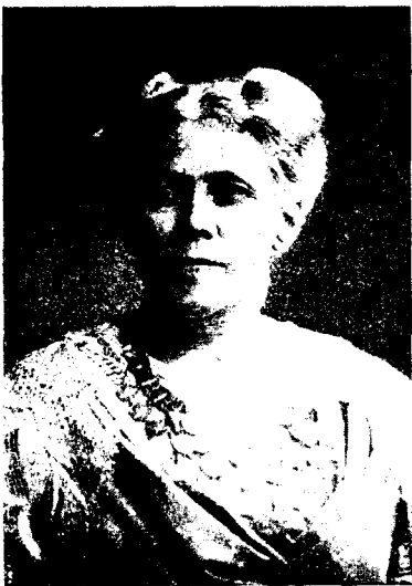
ANN MARGRET HOLMGREN.

OSTRATT FÖR KVINNOR täre vilka känslor och önskr Här nedan följa svaren. I ningsfullhet till vemod öve saknar ridderlighet och gene Ann Margret Holmgren fo genius. För övrigt skola täristiska i de olika svare: