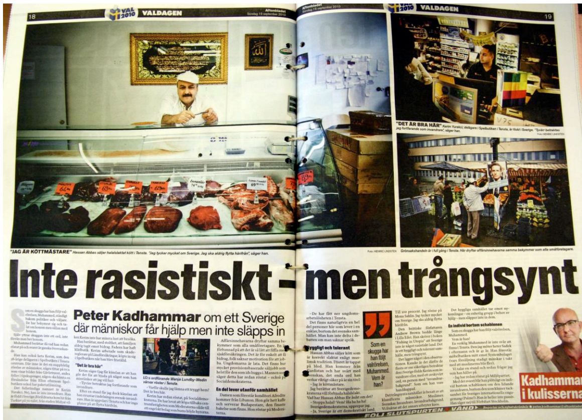
Inte rasistiskt men trångsynt. Faksimil från Aftonbladet den 19 september 2010