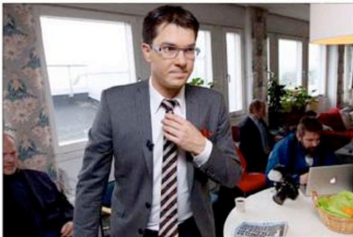
HEKTISK DAG. Alla ville intervjua Jimmie Åkesson som åkte mellan Radiohuset, SVT-huset och riksdagshuset. Samtidigt planerade alliansen för hur de ska klara sig kvar vid makten trots Sverigedemokraternas vägmästarroll i riksdagen.