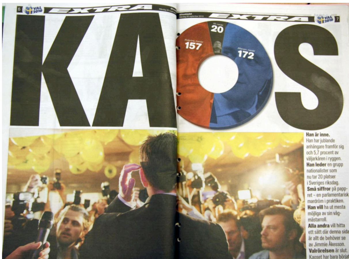
Kaos. Faksimil från Aftonbladet den 20 september 2010.

RESULTAT Åskmolnen tornar upp sig över Jimmie Åkessons hemstad Sölvesborg. Utanför kommunalrådets fönster är vädret gråmulet och bruna höstlöv flyter i bassängen. En labrador skäller inifrån en stängd butik och en tjej får punka på sin cykel. Det är dagen efter valet i medierapporteringen om Sverigedemokraterna.