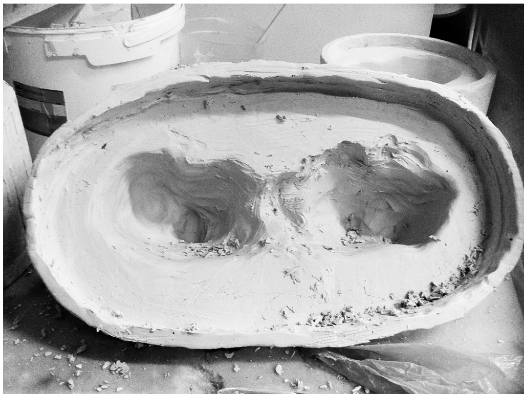
Porslinsgjutform för glas.