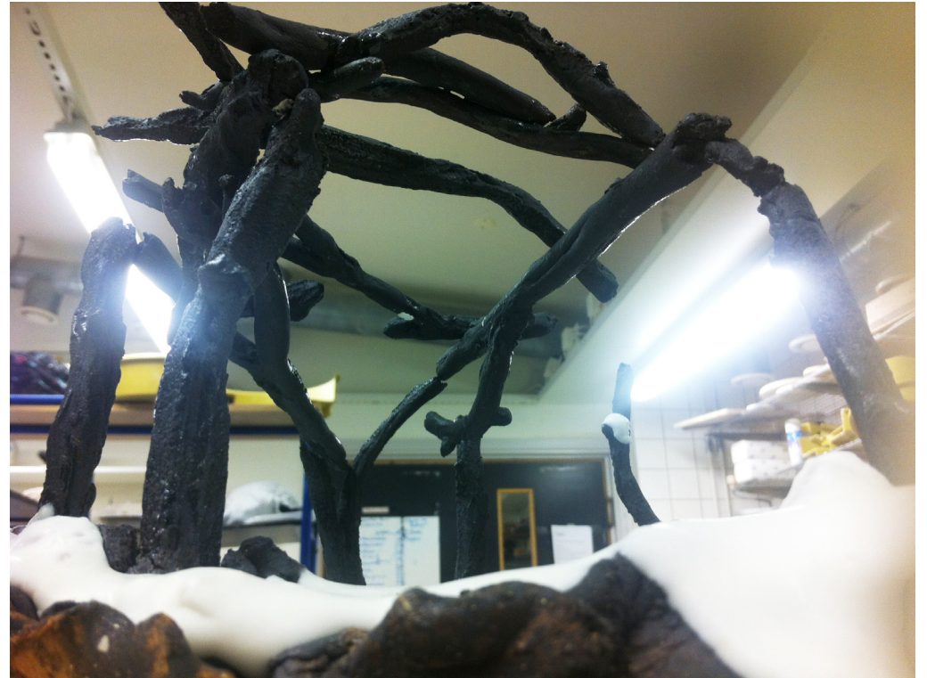
Markbit med tak av pinnar.