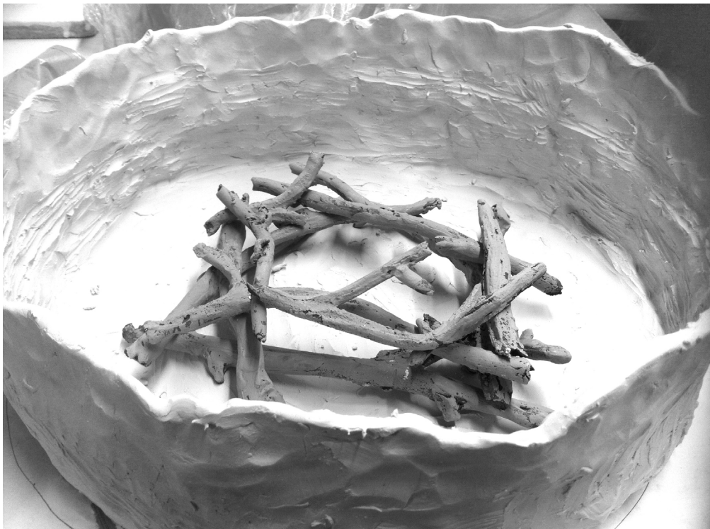
Pinnar i gjutform