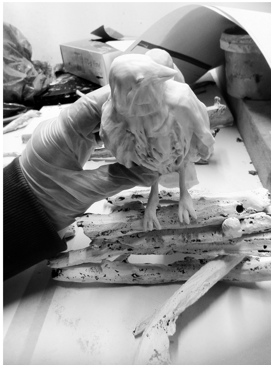
Fågel på pinnar.