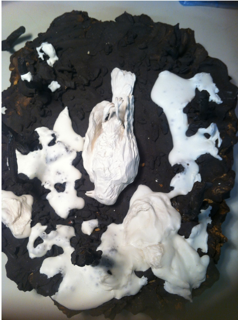
Begravningsplats med en fågel.