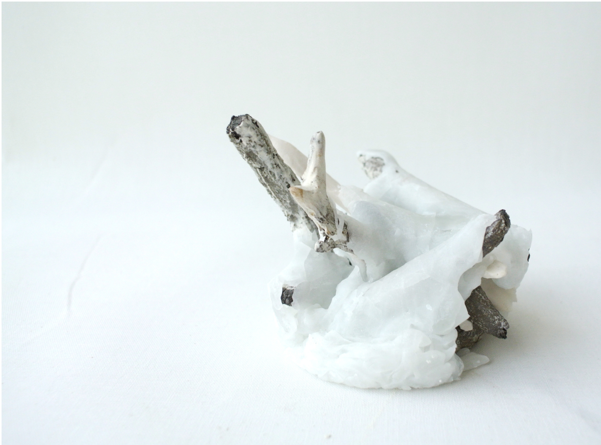
Perfekt snö. Krossad glas, puckoflaska.