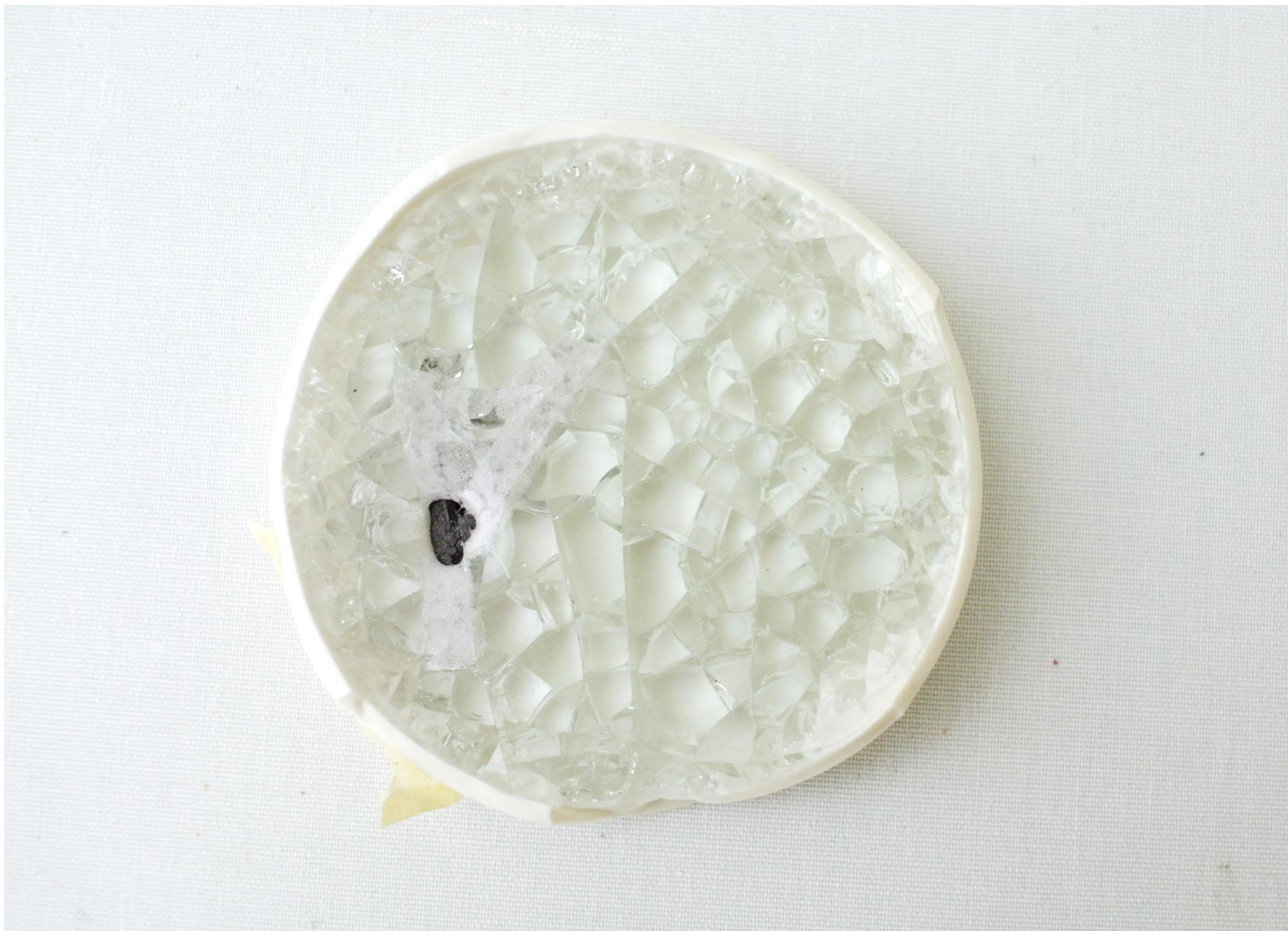
Krossat glas, med svart sten- gods kvist i.