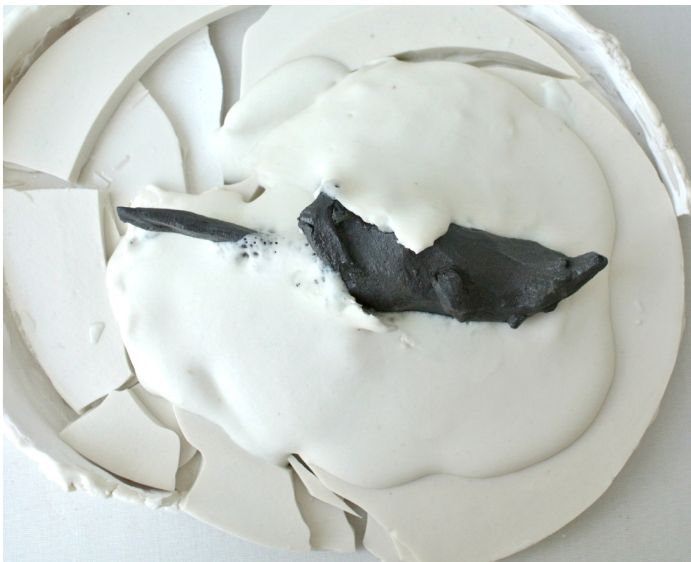
Svart mus i vit snö