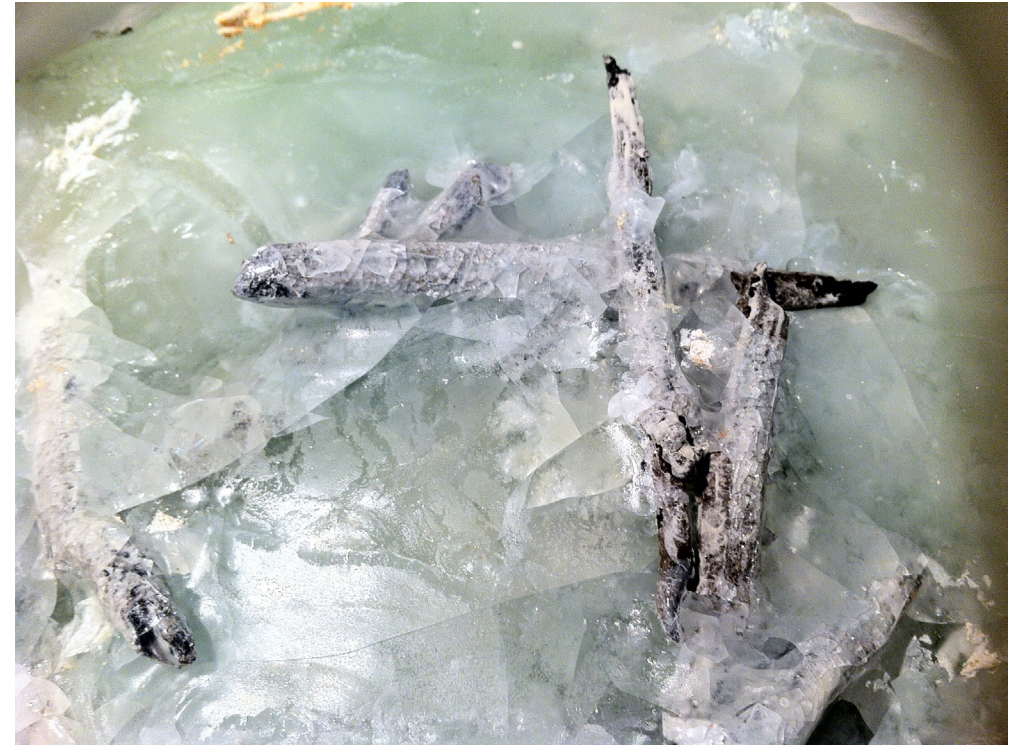
Närbild på pinnar ingjutna i glas