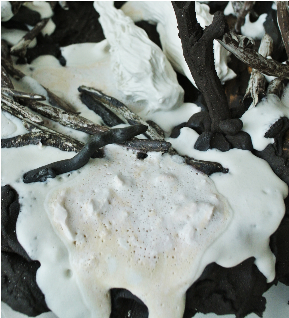
Glasyrer som smält ut för mycket.