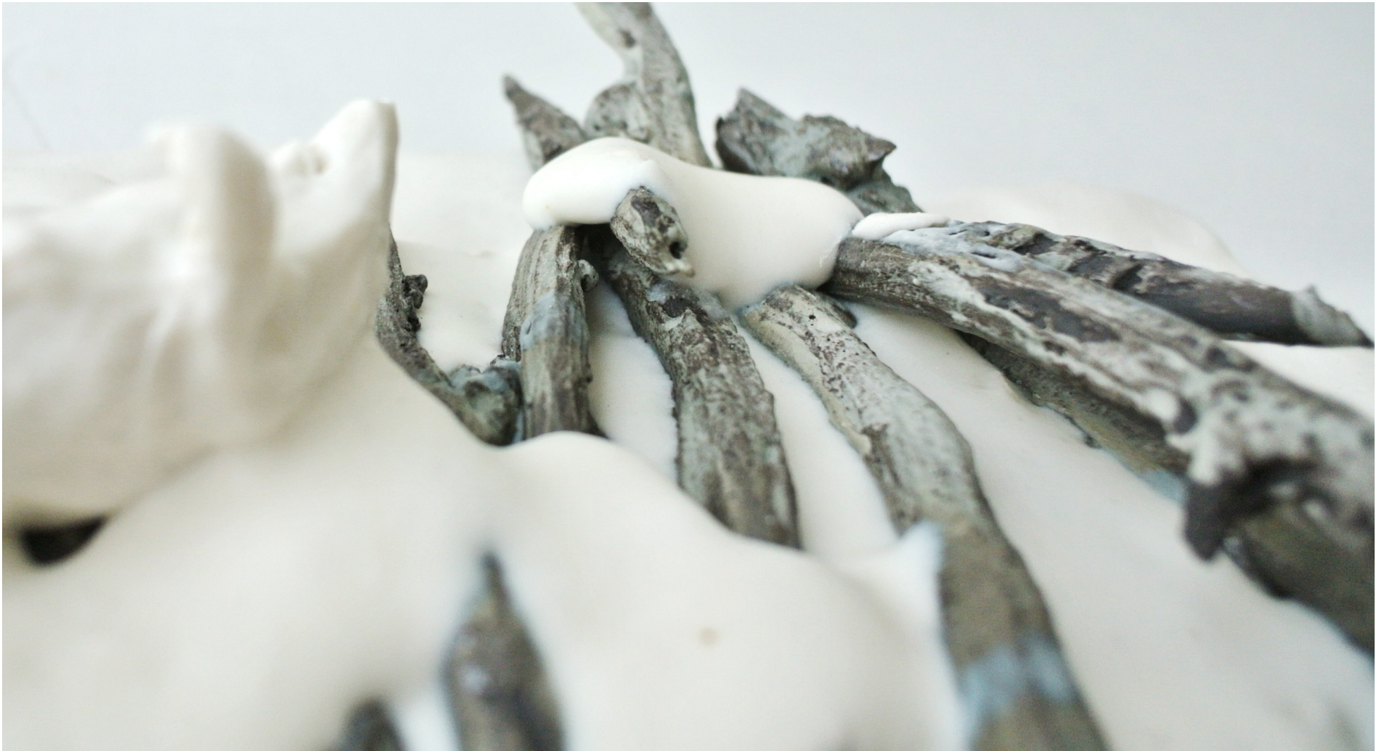
Snö och pinnar.