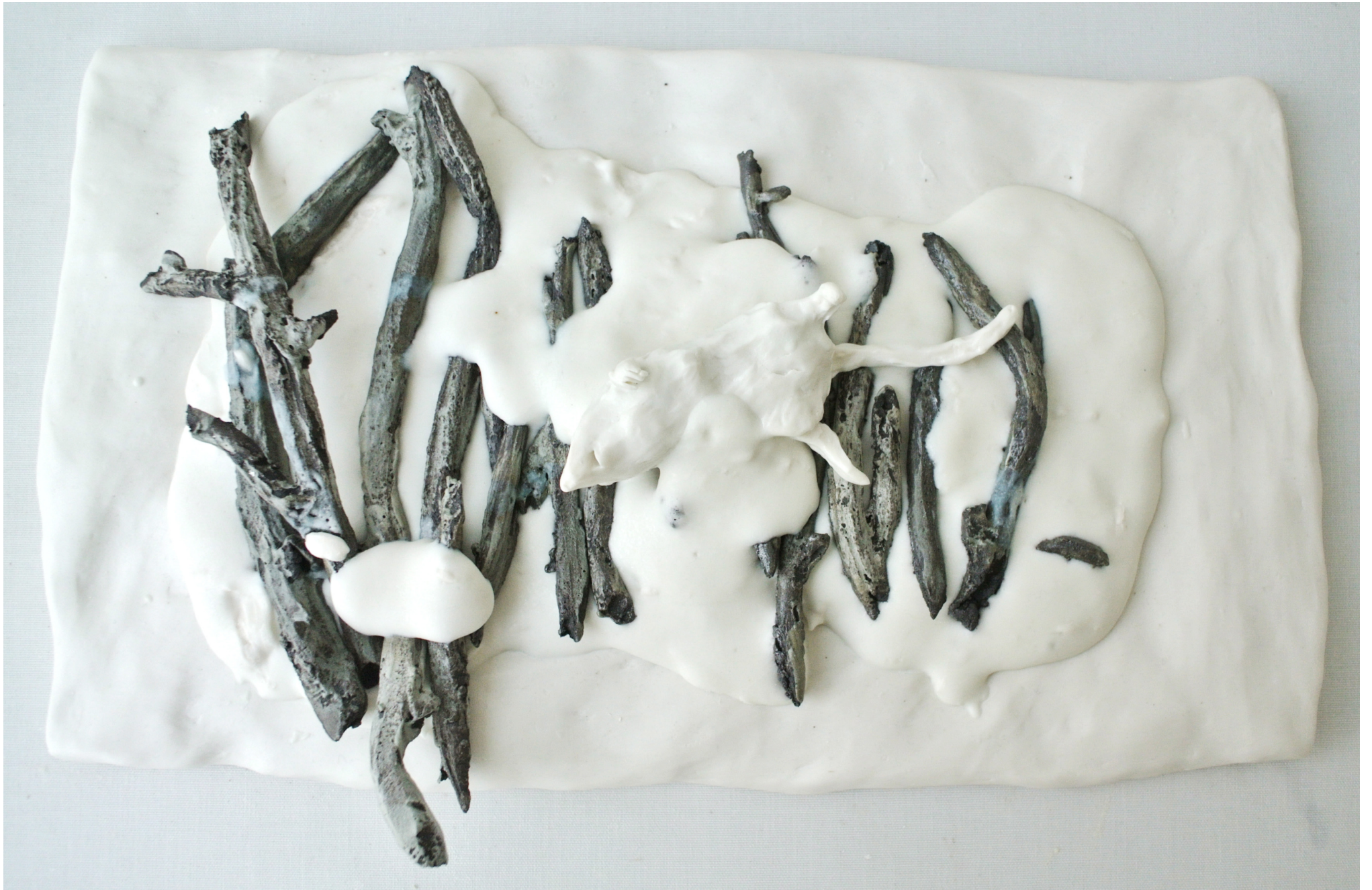
Mus och pinnar i snö