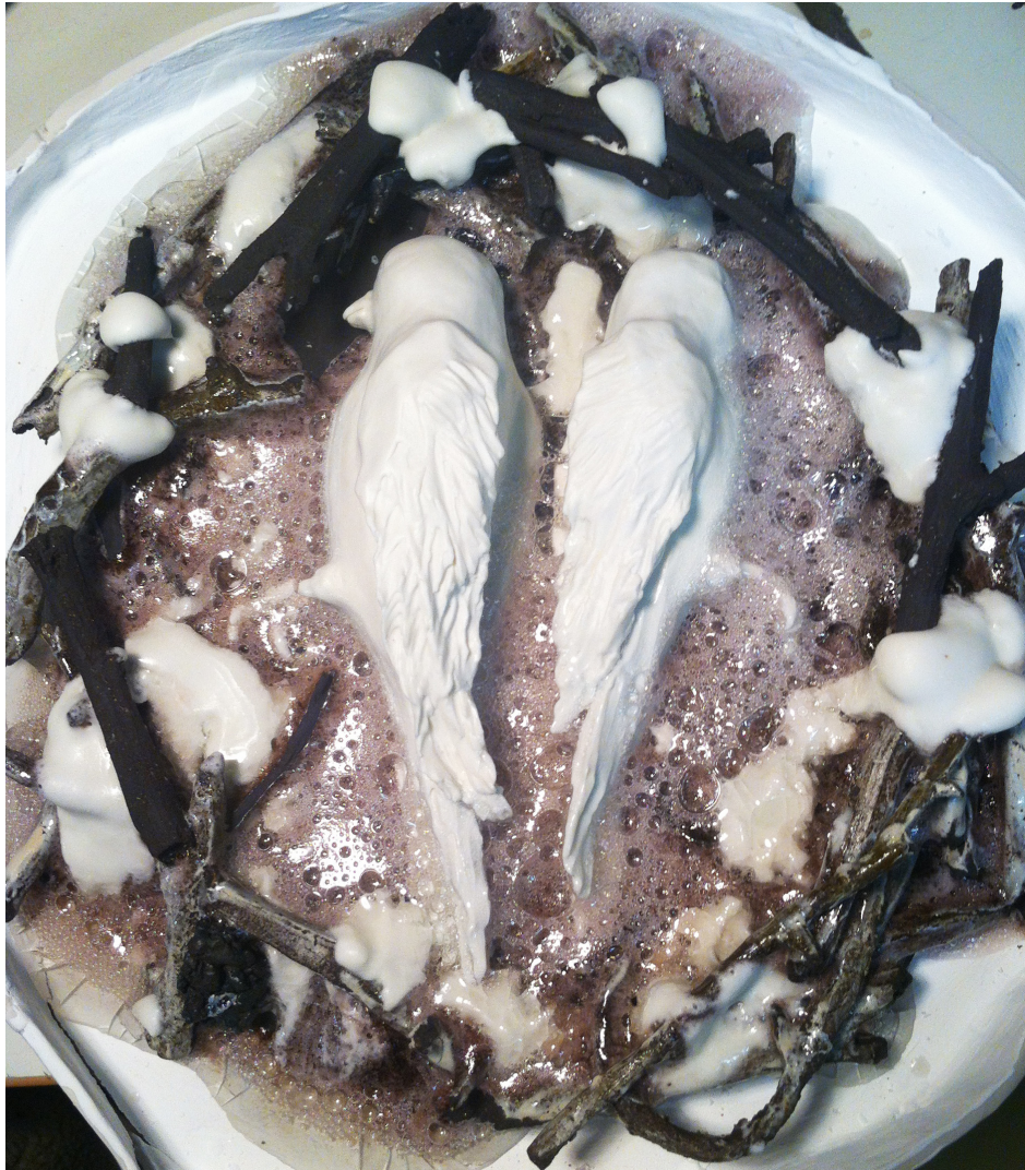
Begravningsplats fåglar. Glaset har bildat bubblor när det brändes till 1280° i samband med manganet i den svarta leran