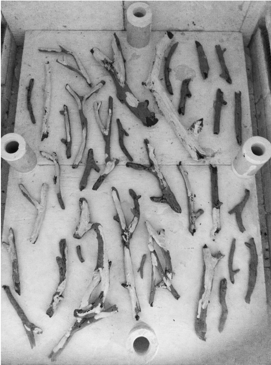
Pinnar utplacerade inför bränning i ugnen