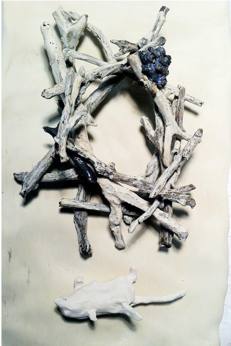
Porslinsmus och pinnar.