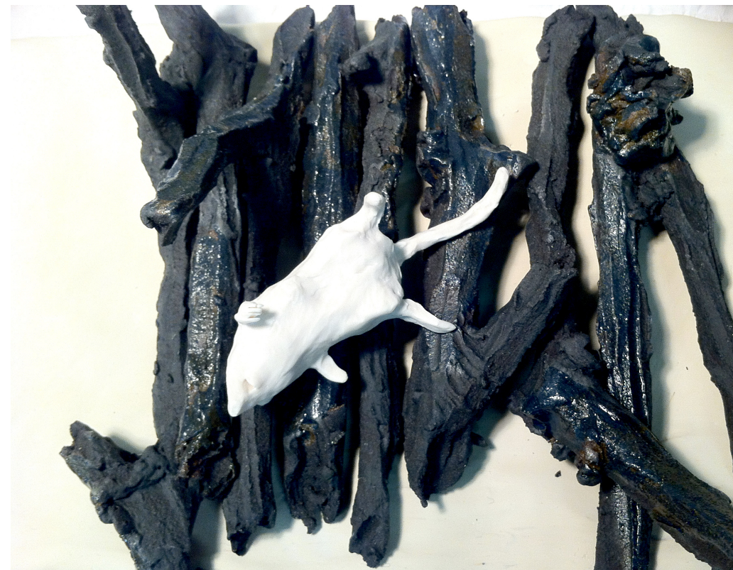
Vit porslinsmus på svarta pinnar