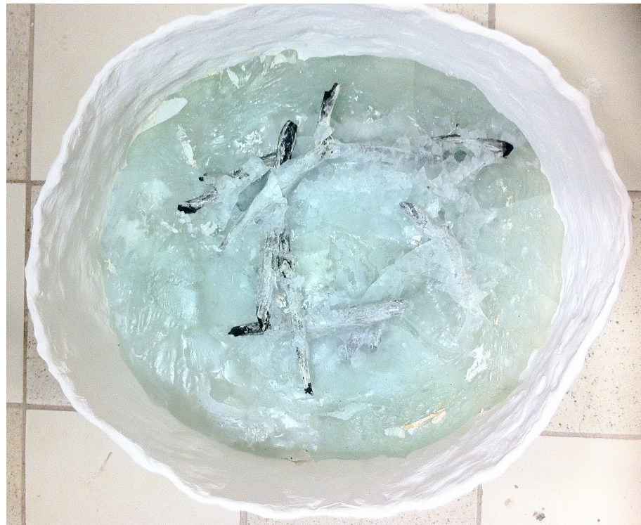
Pinnar ingjutna i glas.