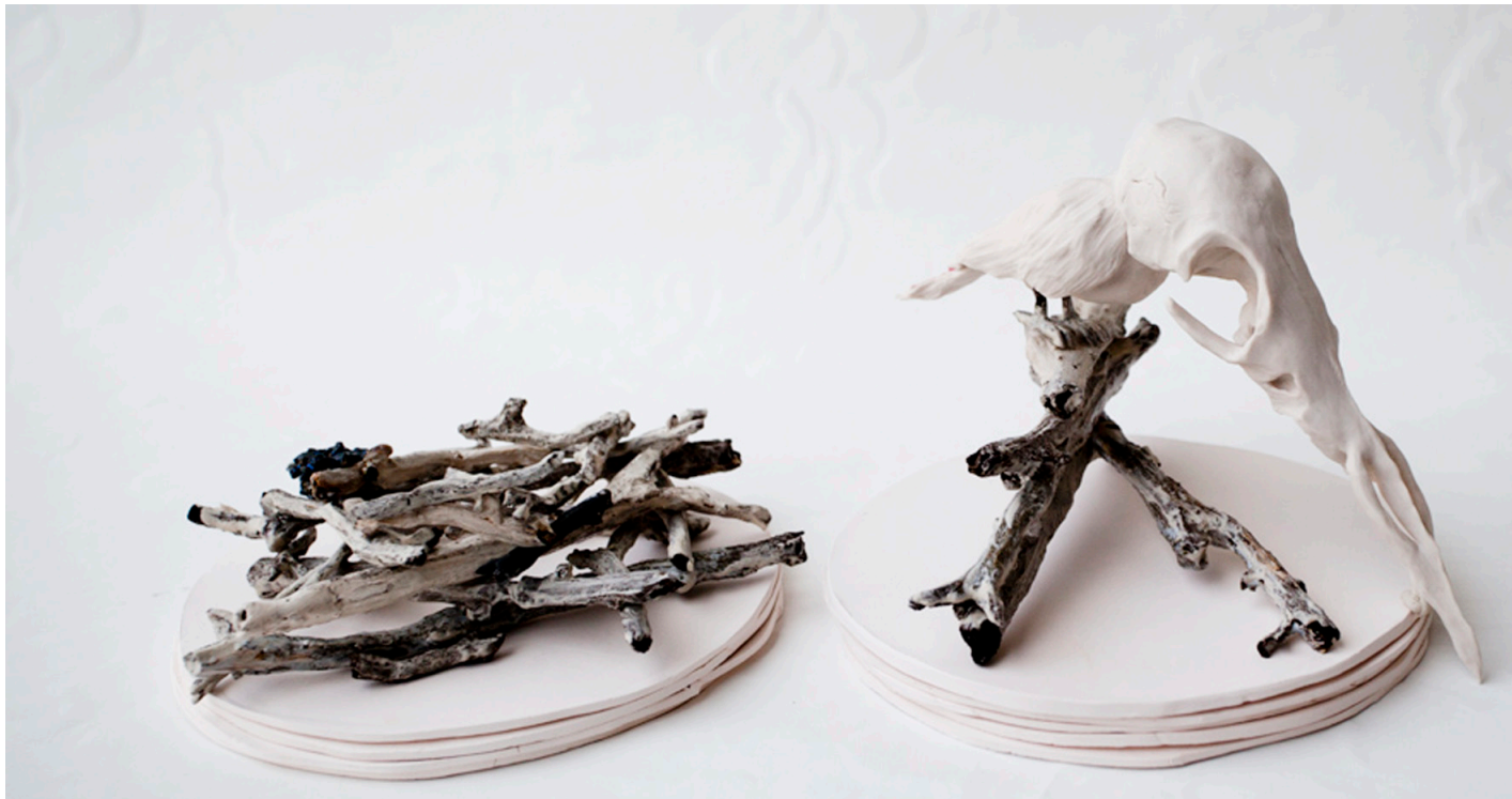
Fågelbo, och fågelbo med fågel på pinnar med ett kranium