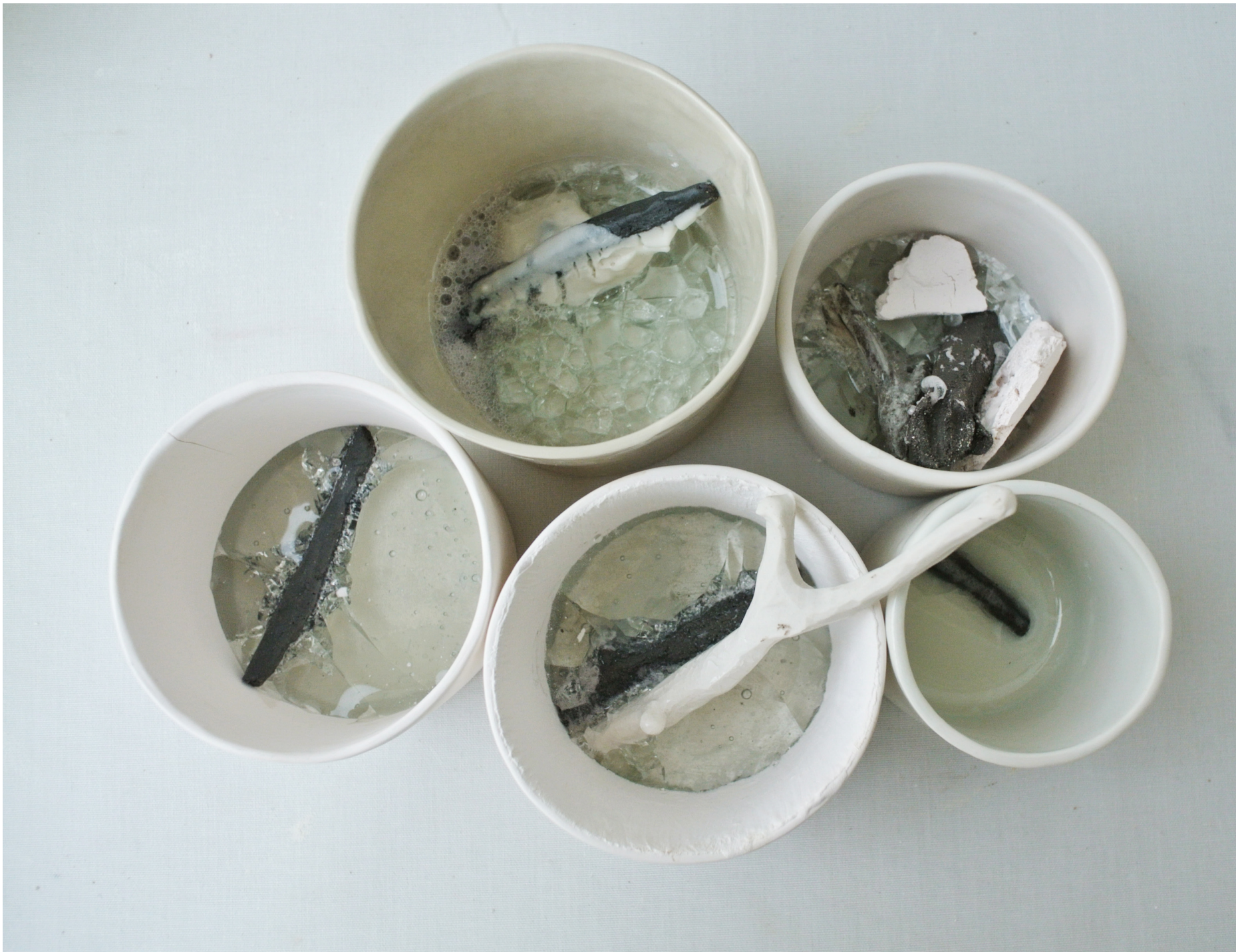
Krossat glas, puckoflaskor.