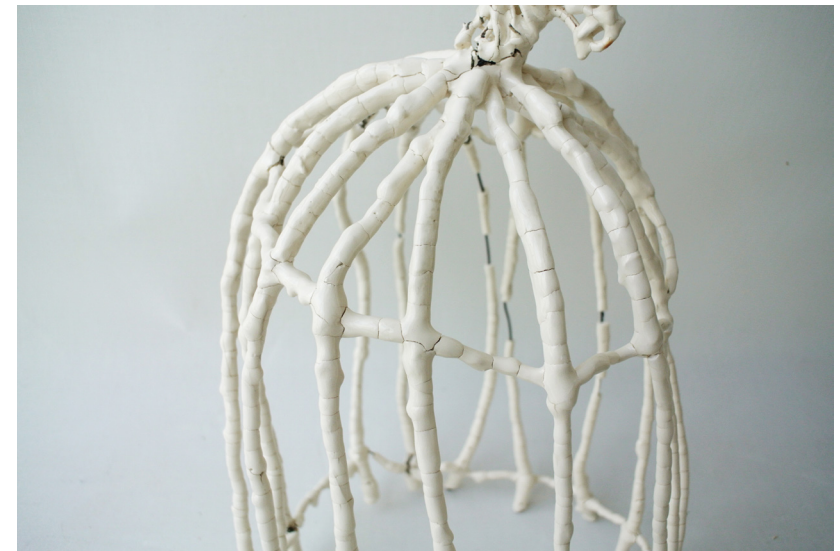
T.V- Undulat med kranium. Ovan- Arbetsplats Närbild på fågelbur