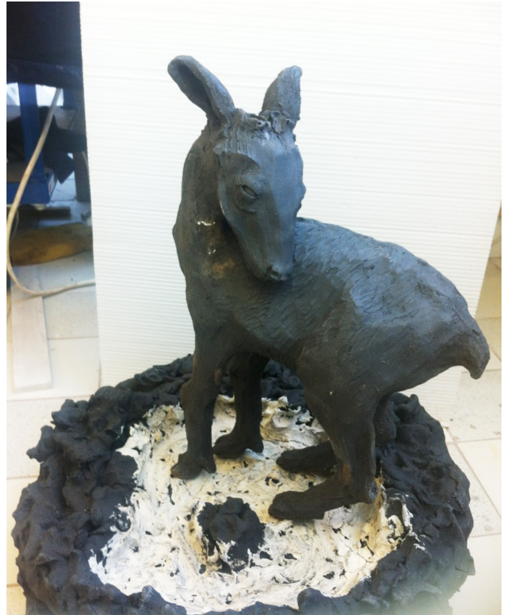
Rådjur utan horn, står på markbit.