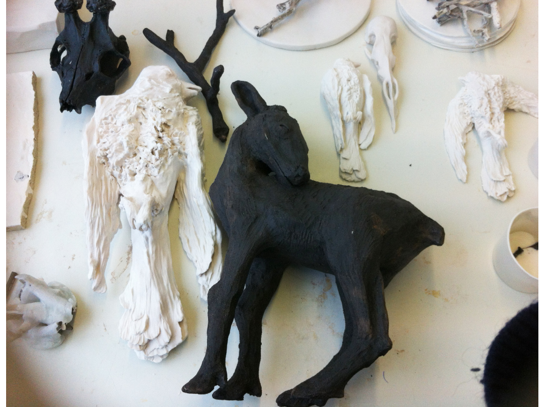
Utplacerade material, vid två olika tillfällen.