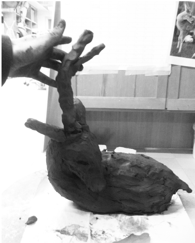
Första lerskiss på rådjur.