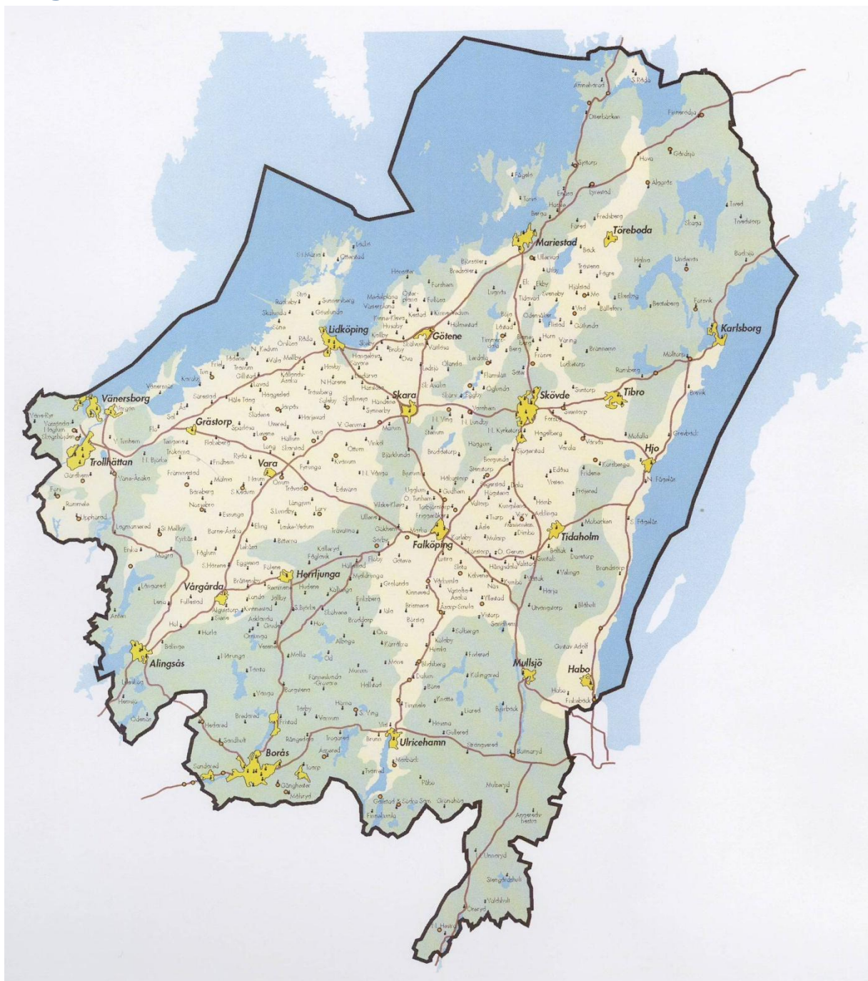
Bilaga 1. Karta över Skara stift 2010. Stiftet var större fram till mitten av 1600-talet då det omfattade också Värmland och Dalsland men har sedan dess haft i stort sett denna utformning med mindre justeringar mot Göteborgs och mot Strängnäs stift.