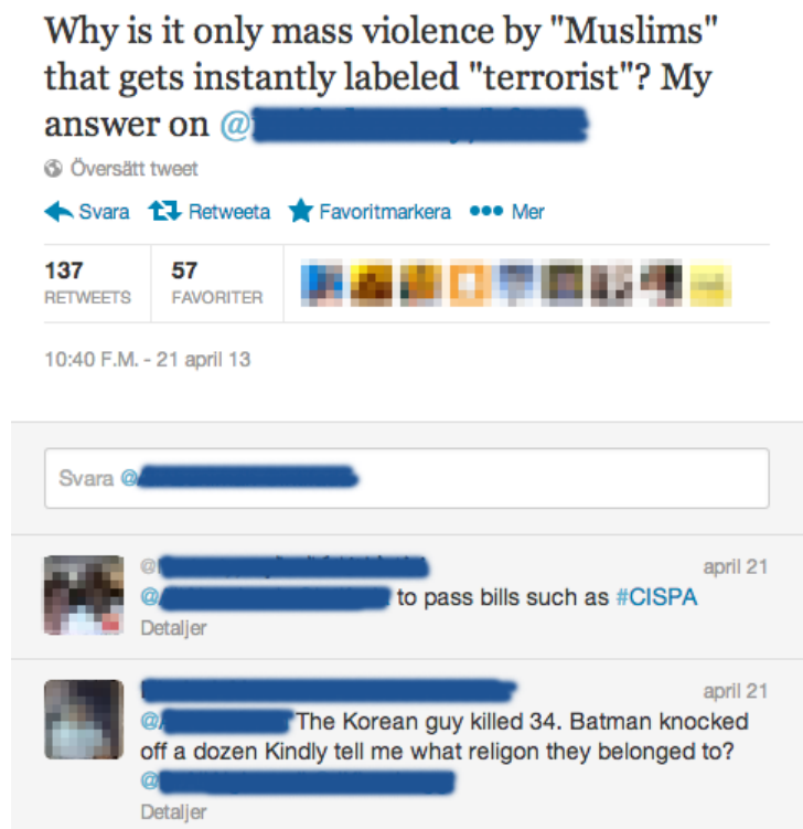
Figur 4 Kommentarsfältets utformning på Twitter

jämför med figur 1). Enligt Baron et. al. (1996) är bekräftelse en del av legitimering av åsikter vilket kan ha en polariserande effekt på grupper. I analysens resultat fanns exempel på att skribenter uppmanade andra medlemmar att ta ställning vilka då använde like-knappen istället för att formulera en text. På Twitter kan ett meddelande bekräftas genom att re-tweetas men då själva kommentarerna inte har en funktion för att mäta tyst, positiv feedback uppstår inte liknande polarisering i diskussionen under ett inlägg.