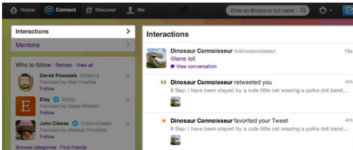
Figur 5 Twitters indikationsutformning