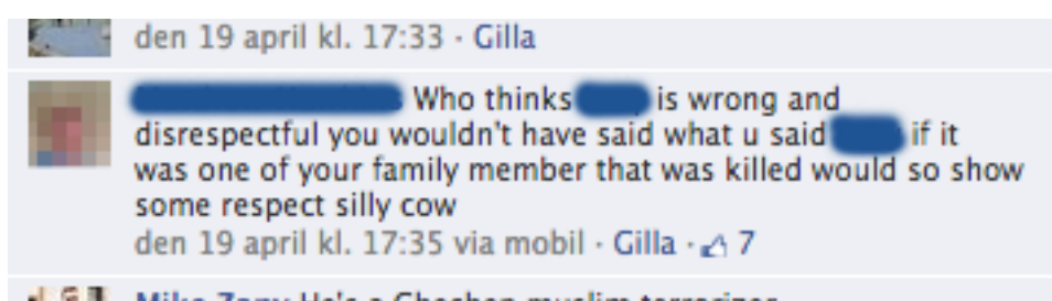
Figur 1 Gilla-knapp i Facebooks kommentarsfält

Meddelanden, eller flöden , är en förbindelse-typ som Kane et al. (2013) definierar som det material som flödar mellan medlemmar som inte nödvändigtvis har en relation. Meddelanden på Twitter kallas tweets och har en begränsning på 140 tecken. I en studie av diskussioner på Twitter, som genomfördes av Yardi och Boyd (2010), visade resultatet på att människor är exponerade för ett stort omfång av åsikter på grund av användningen av hashtags och trending topics som beskrevs ovan. Däremot försvåras en meningsfull diskussion på grund av meddelandenas teckenbegränsning och den höga hastighet som ett ämne toppar och dalar. Även Himmelboim, McCreery och Smith (2013) lyfter fram problemet med att framföra ett djupare resonemang på Twitter men menar också att teckenbegränsningen kan göra innehållet mer koncist. Flöden på Facebook är de texter som publiceras i en öppen grupp eller på en sida vilka har en begränsning på 5000 tecken. Varje enskild text, eller kommentar på en text, har en gilla-knapp vilken ger användare möjlighet att ge en positiv feedback på uttalandet utan att behöva formulera en text. (Se figur 1) I en undersökning av Gerolimos (2011) uttrycktes 82 procent av användardeltagandet via gilla-knappen.