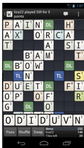
Figur 5. Prt sc. 2013-05-16 http://wordfeud.com

Wordfeud är alltså ett nedladdningsbart, kostnadsfritt spel baserat på det många känner igen som Alfapet. Syftet i spelet är att utmana sin motståndare i att skapa ord, som ger poäng. Spelarna tilldelas slumpvis ett antal bokstäver vardera, som sedan skall spelas på spelplanen och bilda ord. Spelet finns utvecklat för operativsystemen iOS, Android och Windows Phone. Spelet har dessutom en chattfunktion, där spelare har möjlighet att kommunicera med varandra under spelets gång. Nyligen släpptes även funktionalitet som ger spelare möjlighet att följa statistik på antalet vinster och förluster ( http://wordfeud.com ).