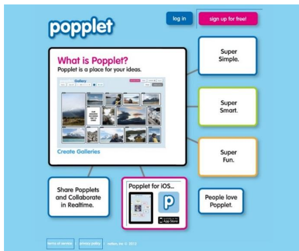
Figur 4. Prt sc. 2013-05-16 http://popplet.com