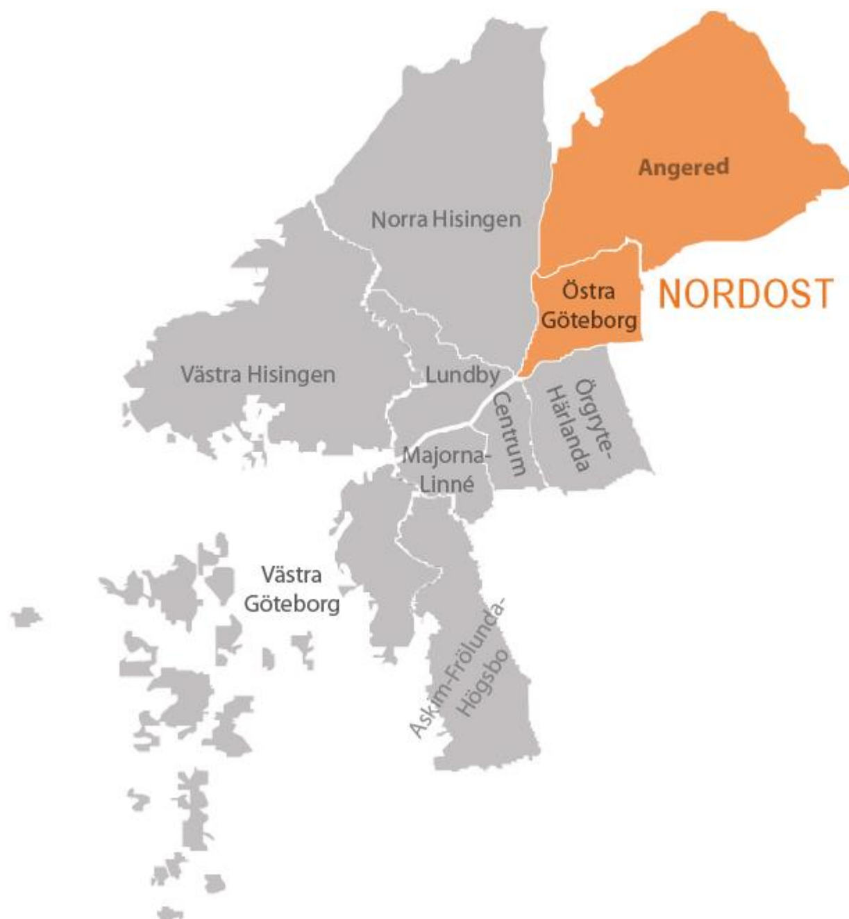
Figur 4. Karta över Göteborgs stadsdelsnämnder med området "nordost" markerat ( www.utvecklingnordost.se ).